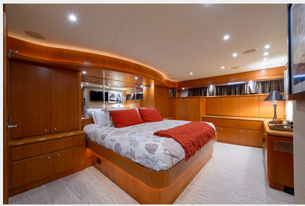
Full Beam Master Stateroom