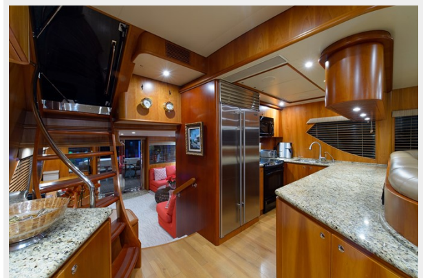
Galley looking aft