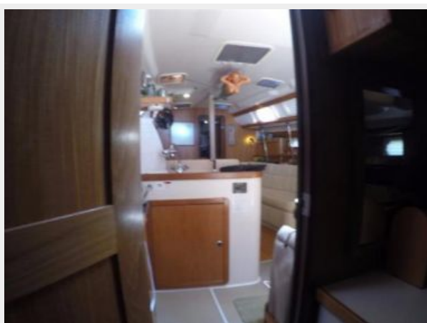
Aft Stateroom Access