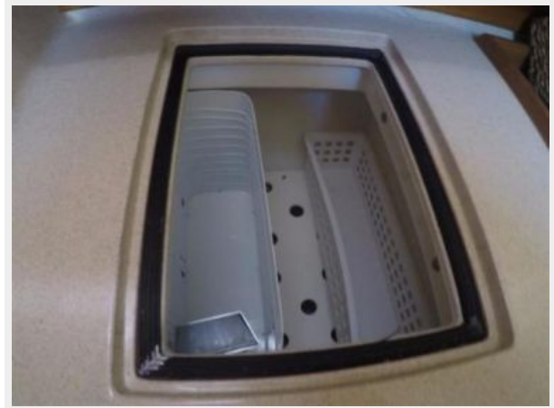
Top and front loading fridge