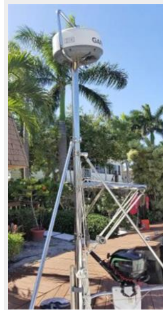
Gimbaled Radar mast w/outboard lift