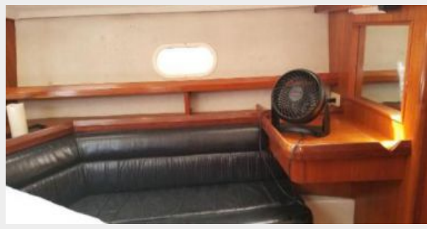
seating & desk in master stateroom