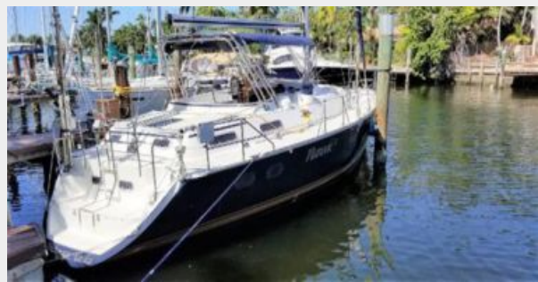
Profile without dingy davits