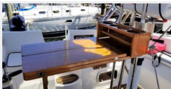
Cockpit Table - 2017