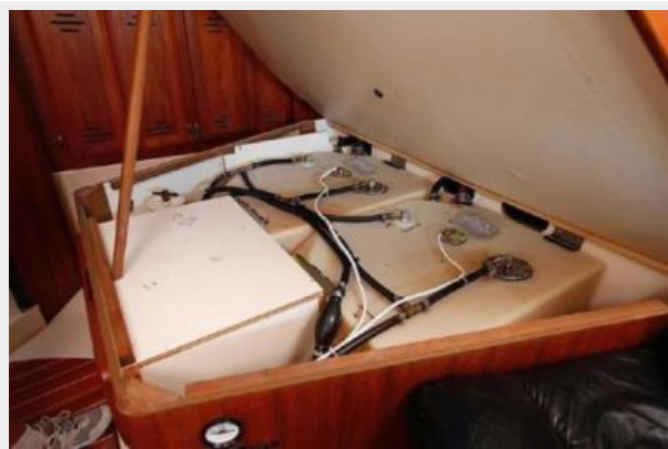
Master Stateroom newer tanks