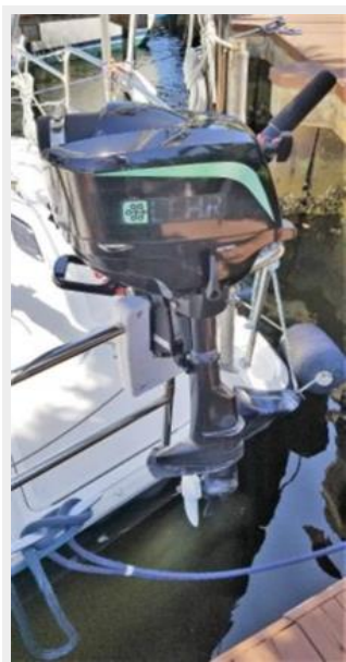
Propane Outboard Motor