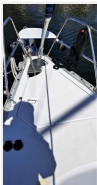
Roller furling drum below decks