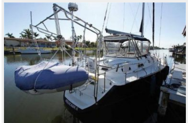
Dingy Davits removed and in storage