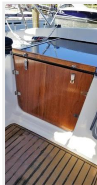
Custom wood doors - 2017