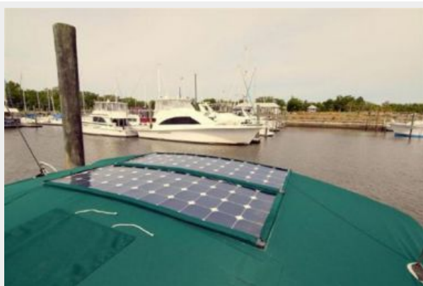
Bimini Top with solar panels