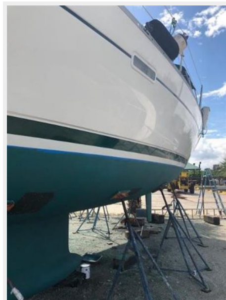
Hull Waxed 09-24-18