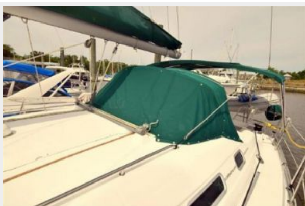
Dodger looking aft