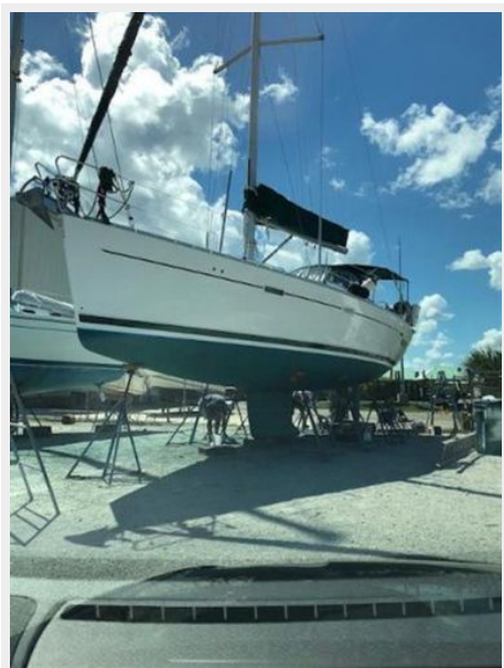
Bottom paint 09-24-18