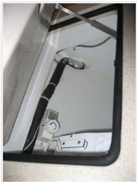
Top loading freezer