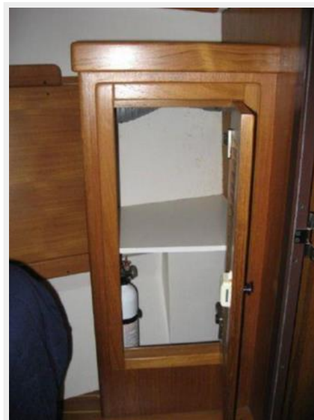
Hanging locker in master