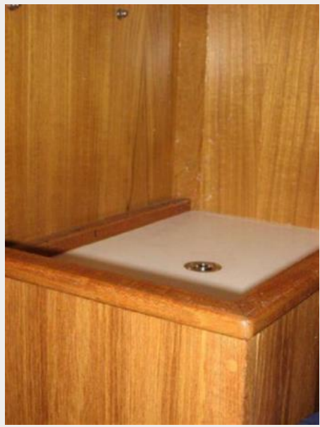
Access to engine in aft cabin