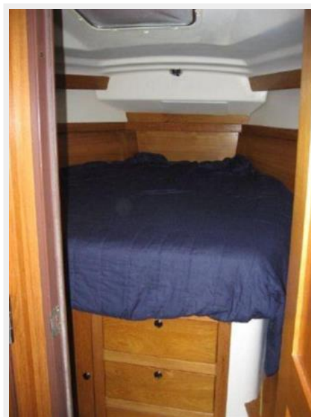
Storage under berth