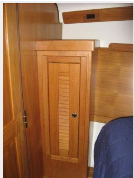
Hanging locker in Master