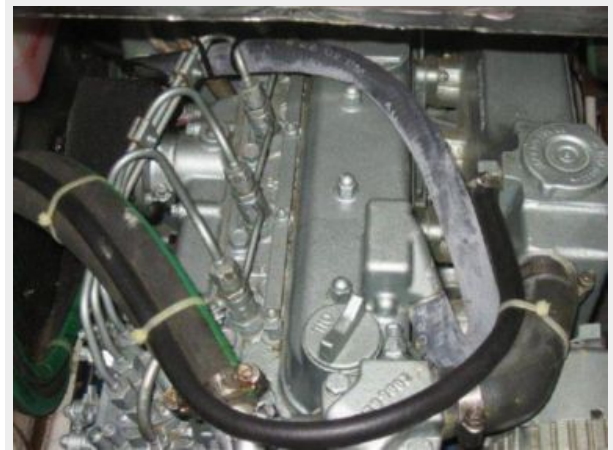
Top view of engine