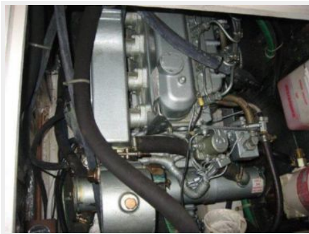
Another view of engine