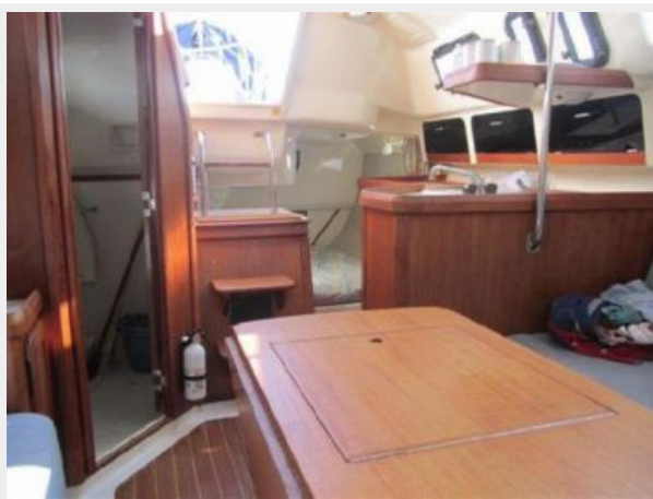
MAIN CABIN LOOKING AFT