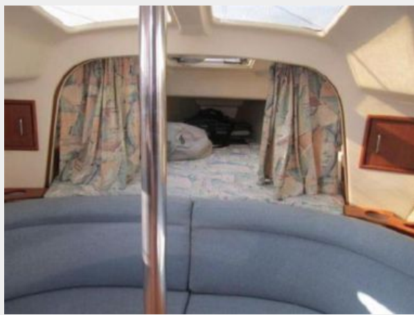
LARGE DOUBLE BERTH FWD