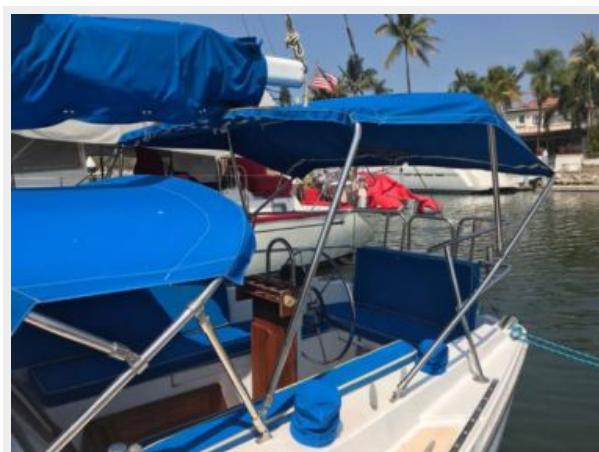
Catalina 30' _13