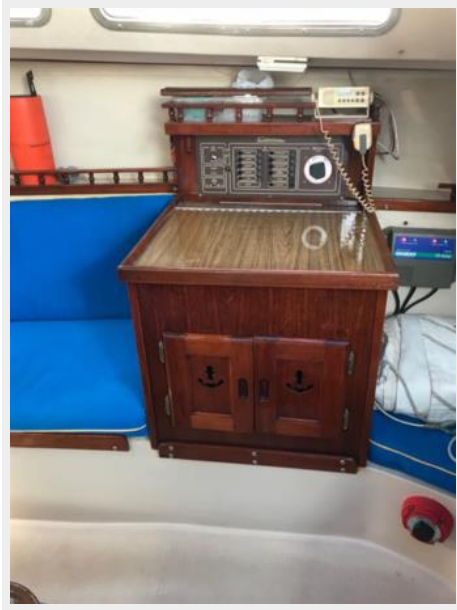
Catalina 30' _22