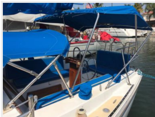
Catalina 30' _11