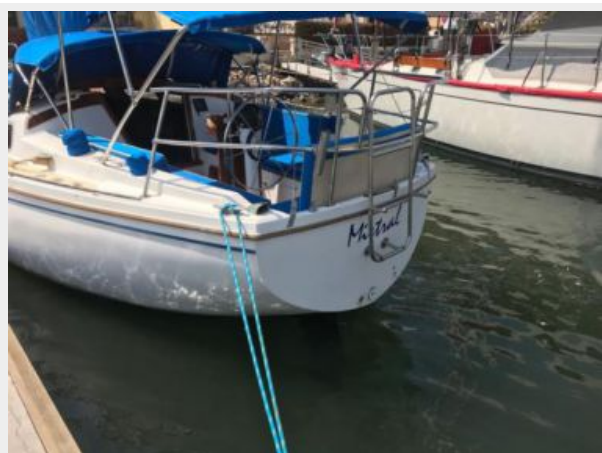
Catalina 30' _10