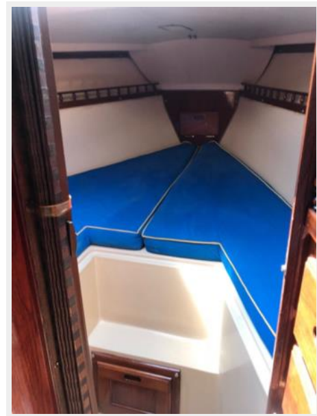
Catalina 30' _25