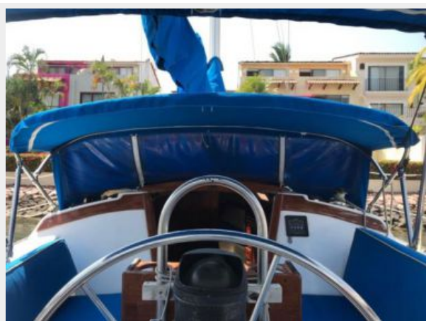
Catalina 30' _14