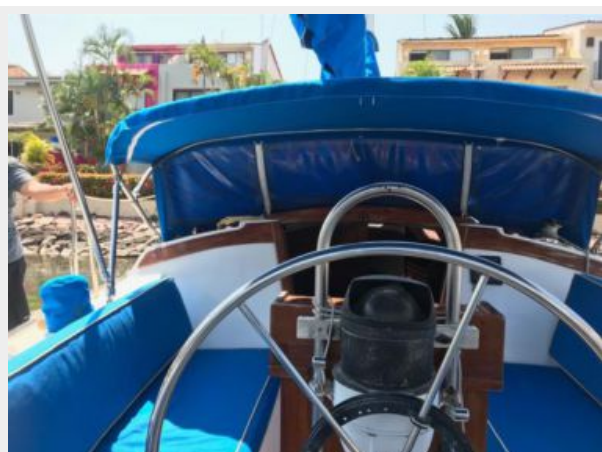
Catalina 30' _12