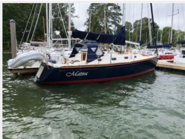
2006 Tartan 3400 Matira