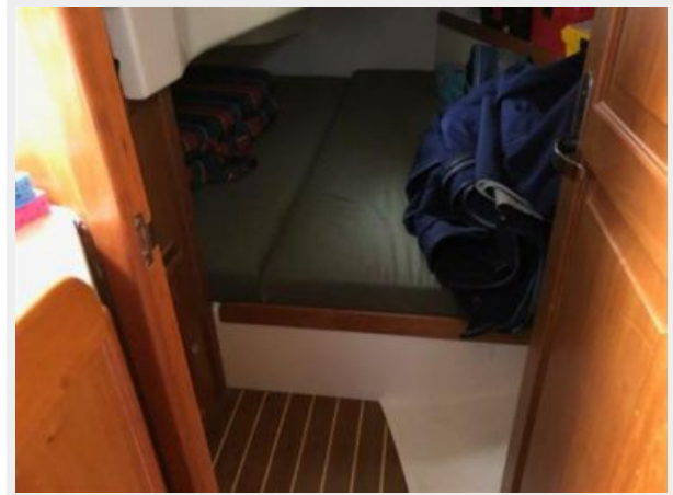
Tartan 3400 Promotional Shot