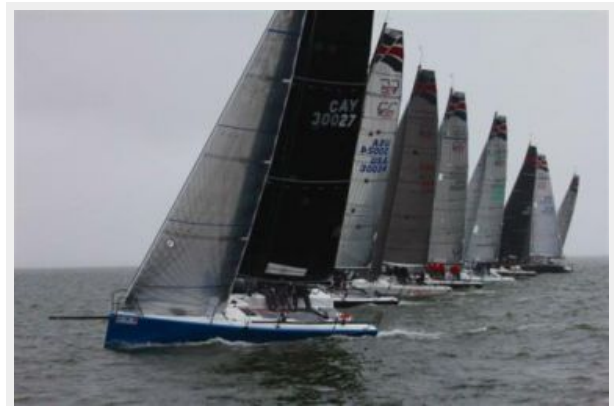
C&C 30 One Design Start