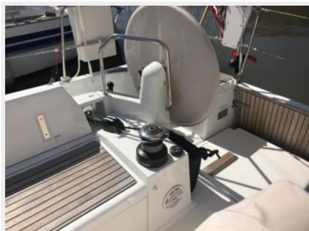
Jeanneau Odyssey 440_16