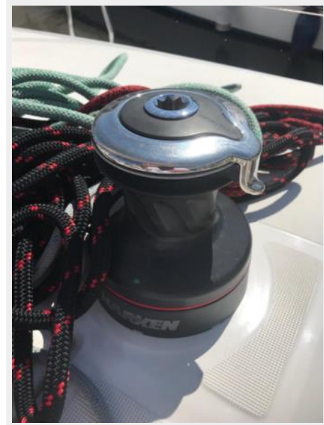
Jeanneau Odyssey 440_29