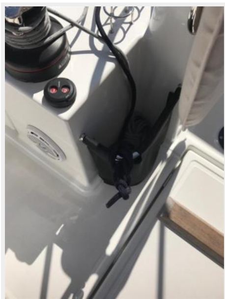
Jeanneau Odyssey 440_26