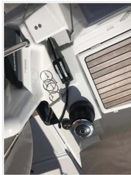
Jeanneau Odyssey 440_13