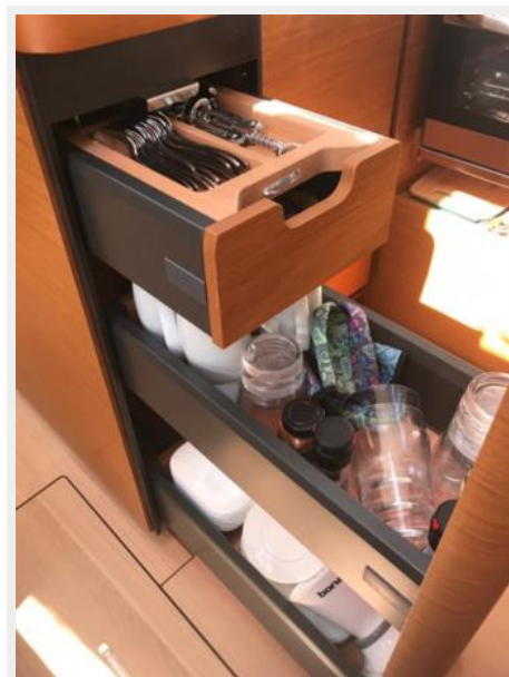
Jeanneau Odyssey 440_47