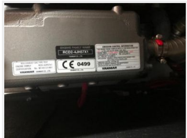
Jeanneau Odyssey 440_69