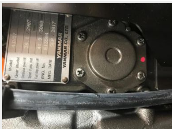
Jeanneau Odyssey 440_70