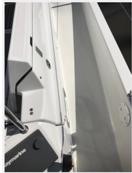
Jeanneau Odyssey 440_55