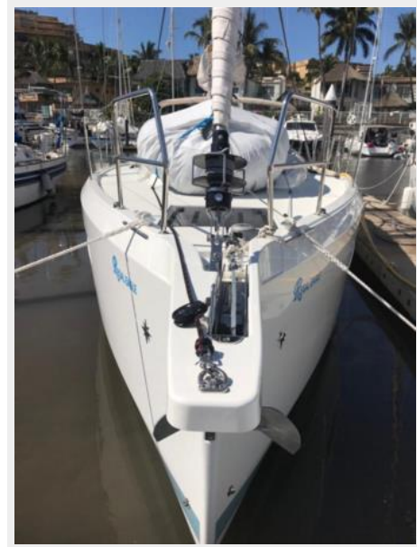
Jeanneau Odyssey 440_03