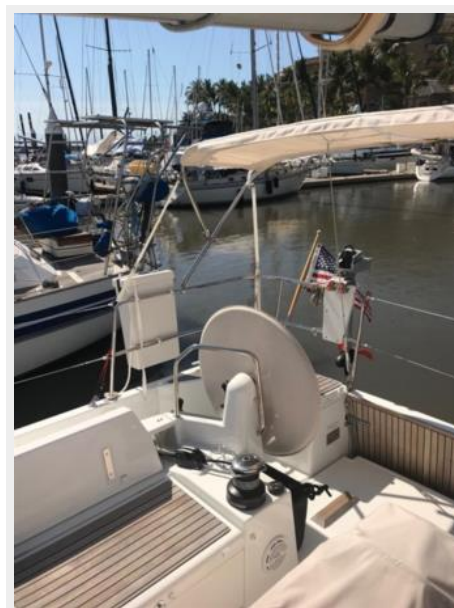
Jeanneau Odyssey 440_17