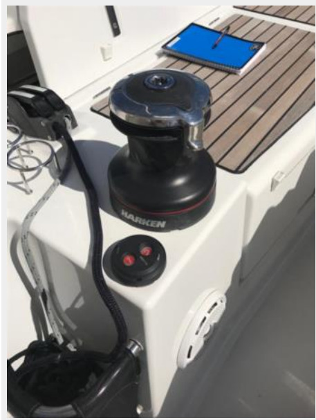
Jeanneau Odyssey 440_28