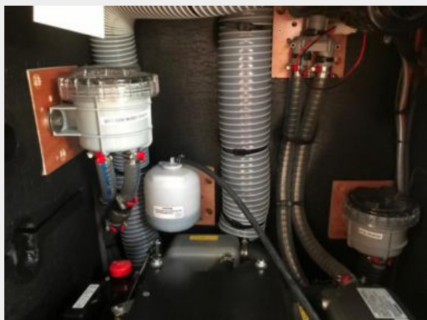
Jeanneau Odyssey 440_72