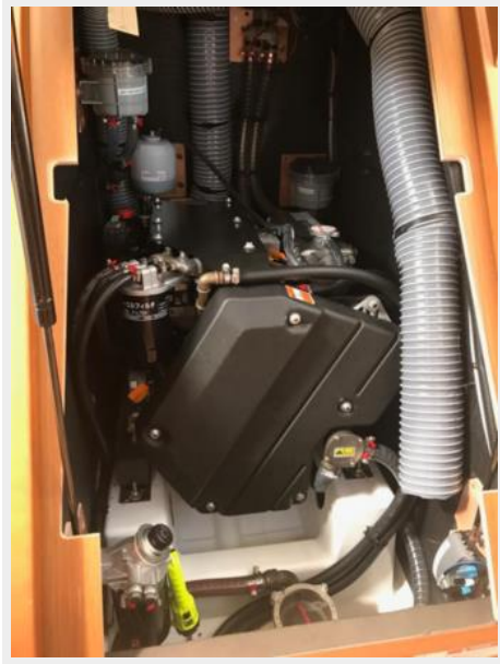
Jeanneau Odyssey 440_66