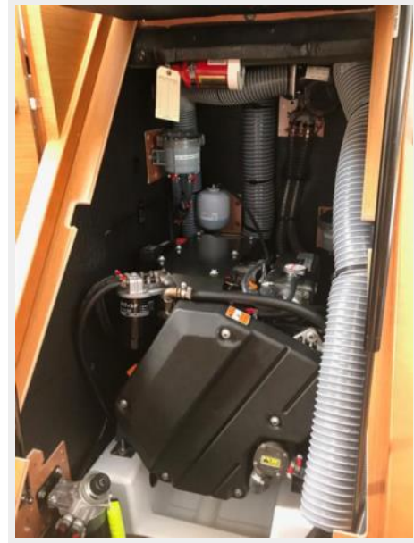
Jeanneau Odyssey 440_67