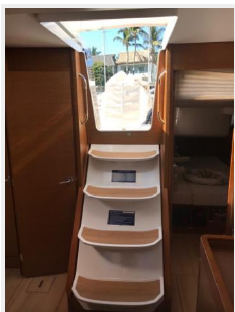
Jeanneau Odyssey 440_48