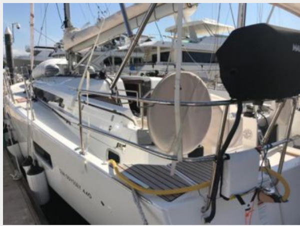
Jeanneau Odyssey 440_06