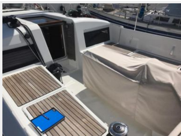
Jeanneau Odyssey 440_12