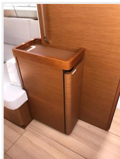
Jeanneau Odyssey 440_39