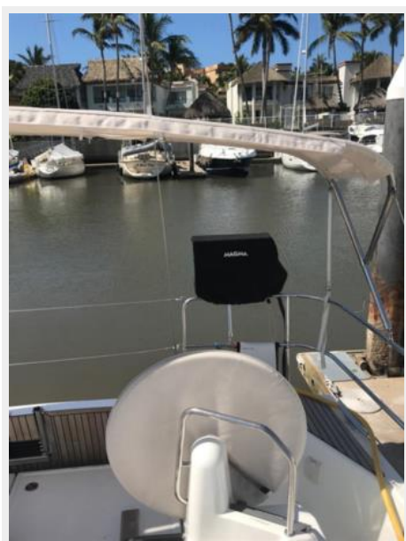
Jeanneau Odyssey 440_18