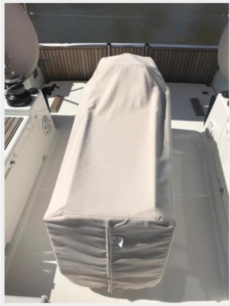
Jeanneau Odyssey 440_20