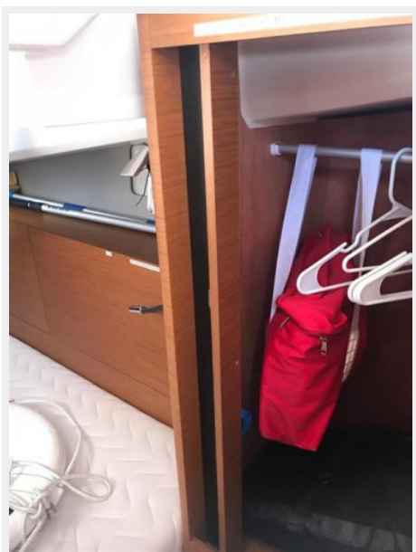
Jeanneau Odyssey 440_34