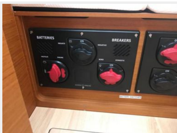
Jeanneau Odyssey 440_64