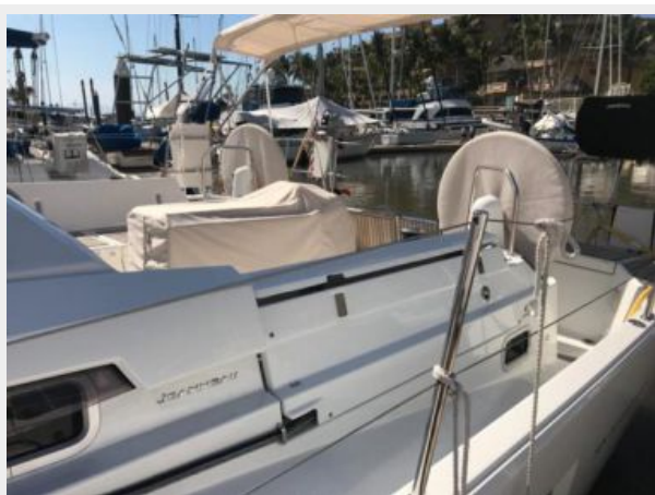
Jeanneau Odyssey 440_10