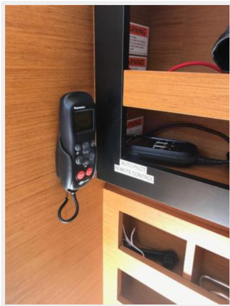
Jeanneau Odyssey 440_30