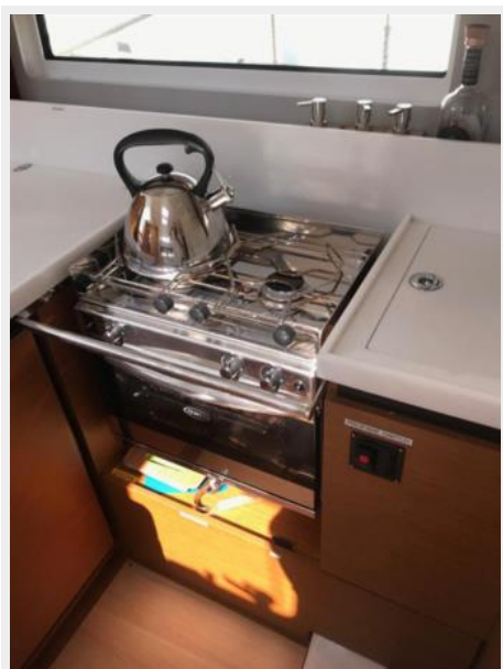
Jeanneau Odyssey 440_46