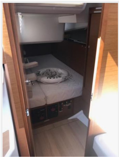
Jeanneau Odyssey 440_32