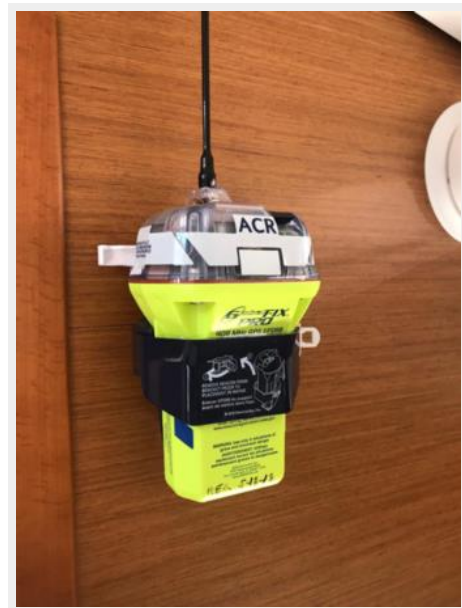
Jeanneau Odyssey 440_63