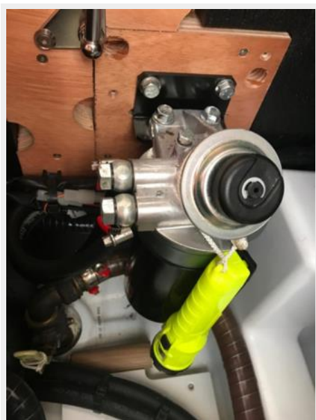
Jeanneau Odyssey 440_74