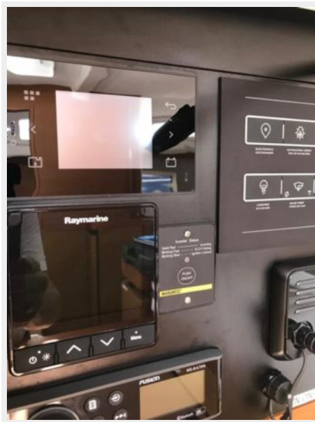
Jeanneau Odyssey 440_60