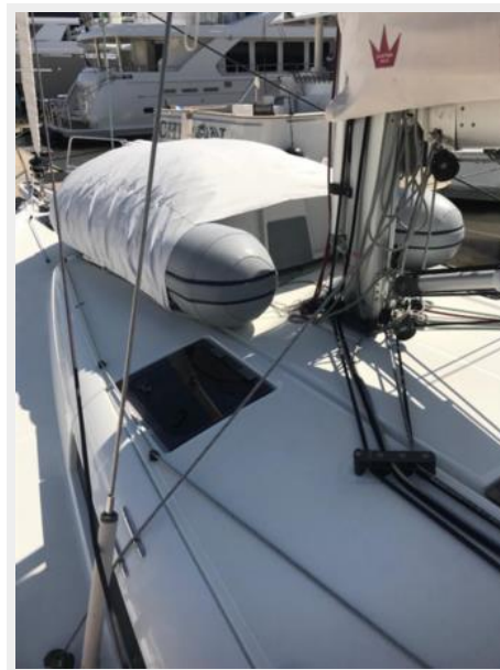
Jeanneau Odyssey 440_25