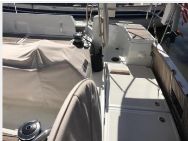
Jeanneau Odyssey 440_14