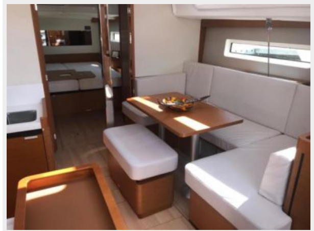
Jeanneau Odyssey 440_41