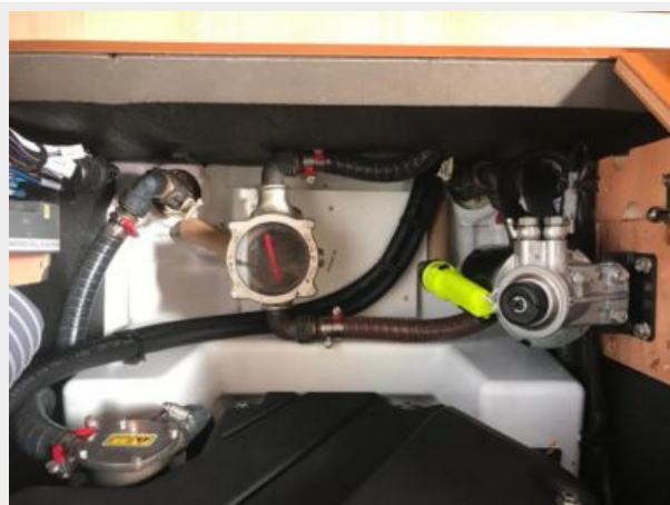
Jeanneau Odyssey 440_68