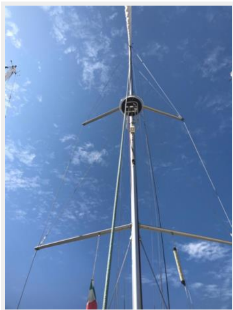
Jeanneau Odyssey 440_24