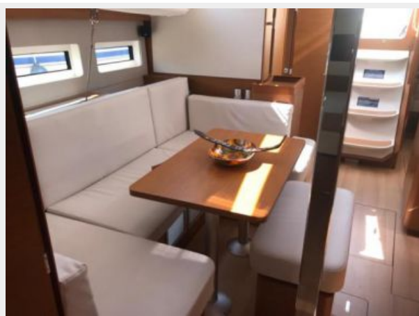
Jeanneau Odyssey 440_42