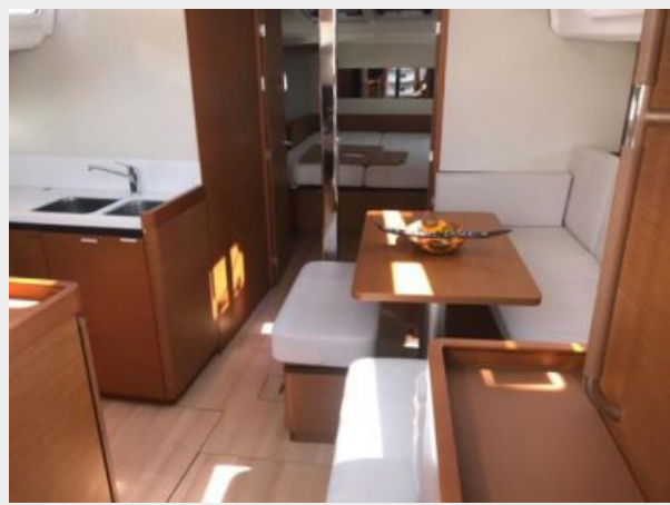
Jeanneau Odyssey 440_40