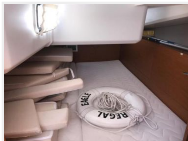
Jeanneau Odyssey 440_33