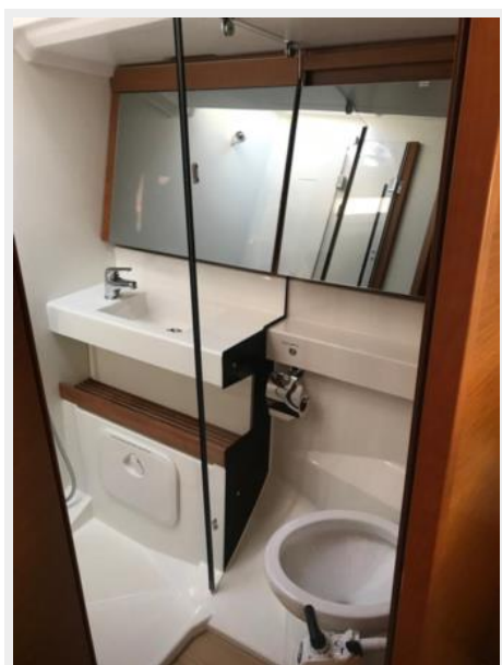
Jeanneau Odyssey 440_52