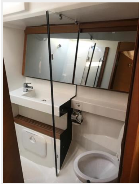
Jeanneau Odyssey 440_54