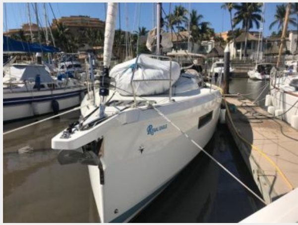
Jeanneau Odyssey 440_02