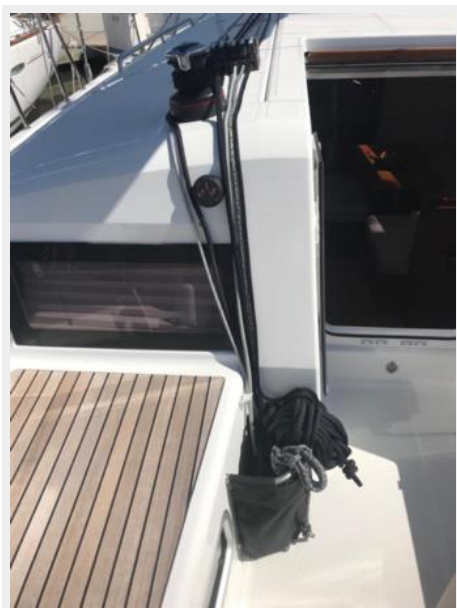
Jeanneau Odyssey 440_56