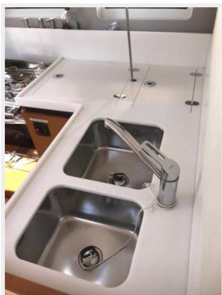
Jeanneau Odyssey 440_44