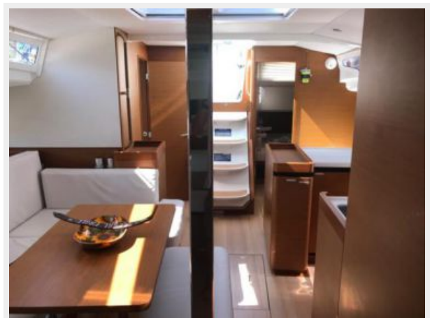
Jeanneau Odyssey 440_43