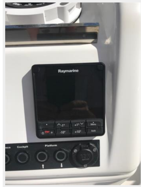
Jeanneau Odyssey 440_59