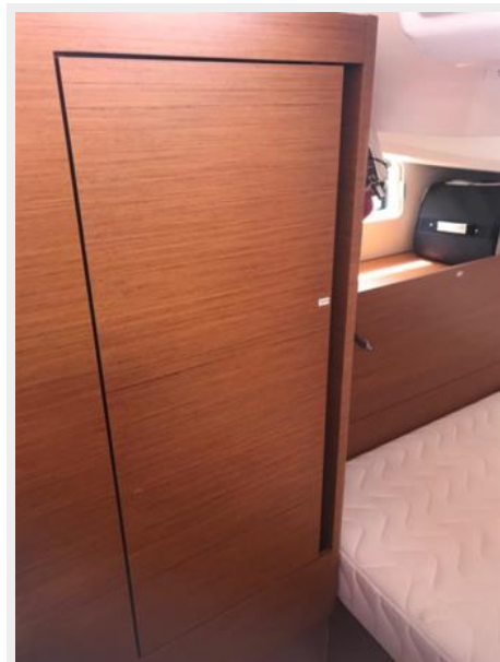
Jeanneau Odyssey 440_39