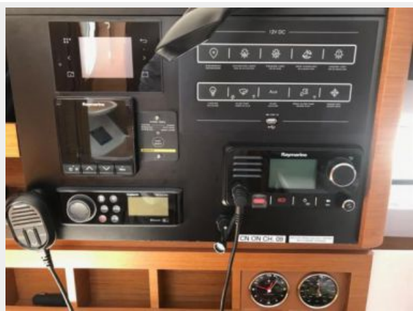
Jeanneau Odyssey 440_62