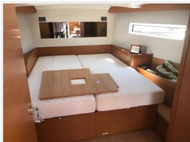
Jeanneau Odyssey 440_50