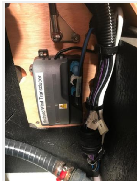
Jeanneau Odyssey 440_73