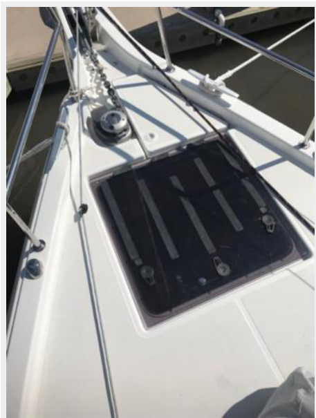
Jeanneau Odyssey 440_22