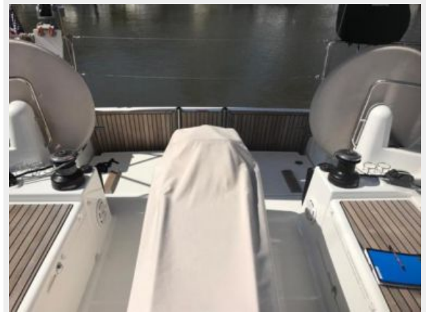
Jeanneau Odyssey 440_21