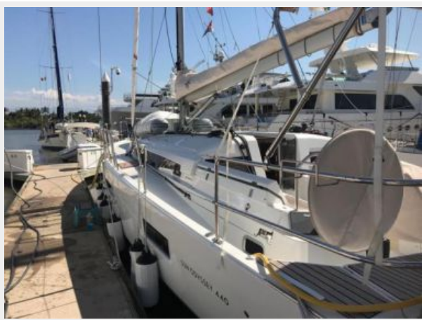
Jeanneau Odyssey 440_04