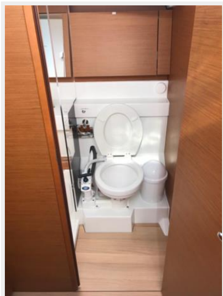
Jeanneau Odyssey 440_36