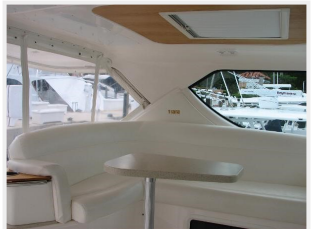
Helm Lounge with Table