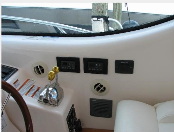
Helm Air Conditioning Controls