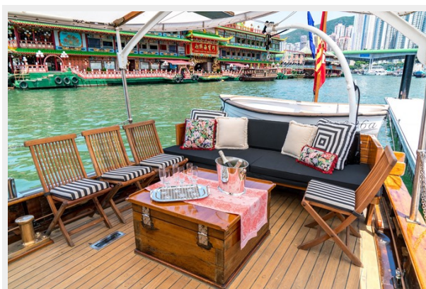
Aft deck lounge