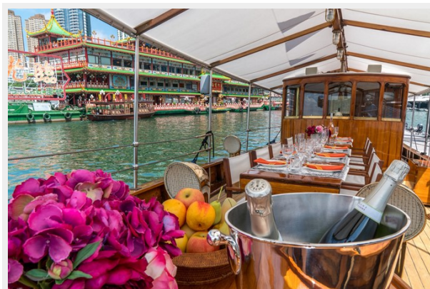
Main Deck Dining for 10 guests