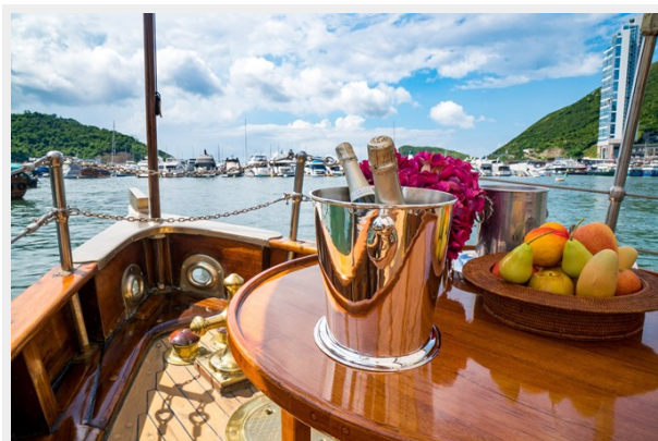
Fore deck serving table