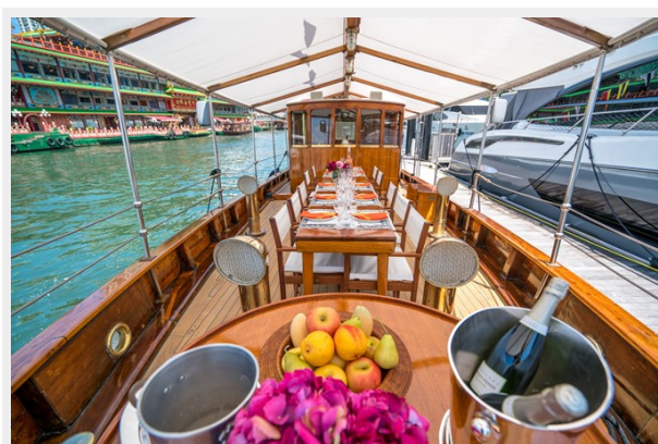
View of wheelhouse