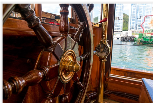
Classic teak wheel and brass throttle