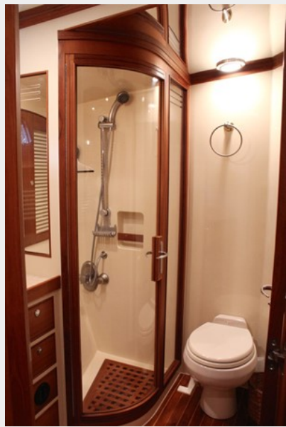
VIP Head Shower