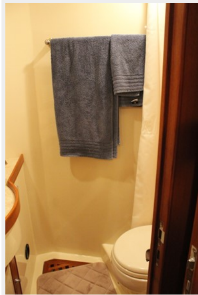
Port Guest Head