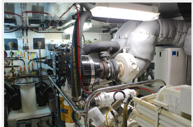
Engine Room Starboard