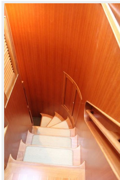
Stairs to Lower Deck