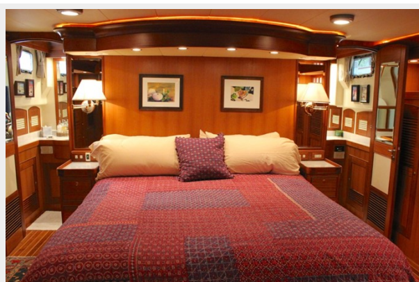
Master Stateroom Aft