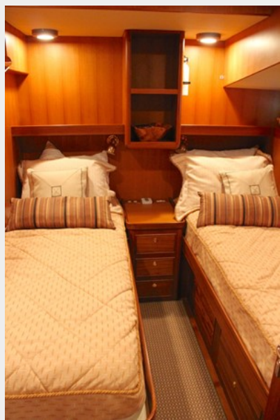
Port Guest Stateroom