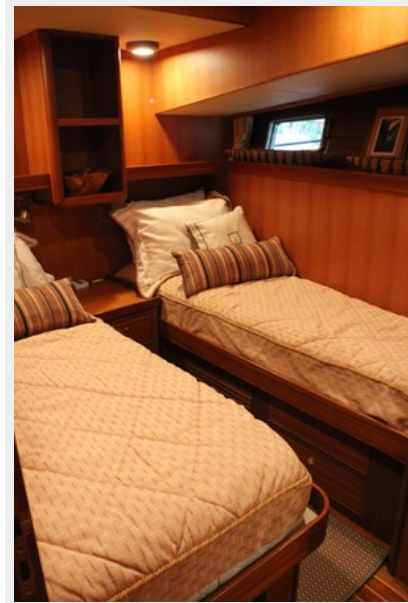
Port Gues Stateroom 2