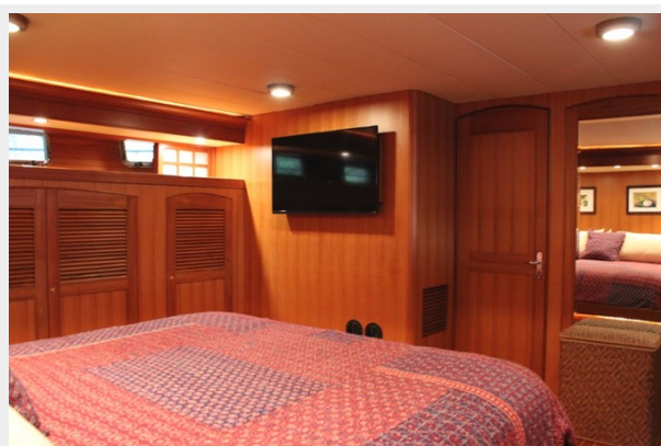
Master Stateroom Forward