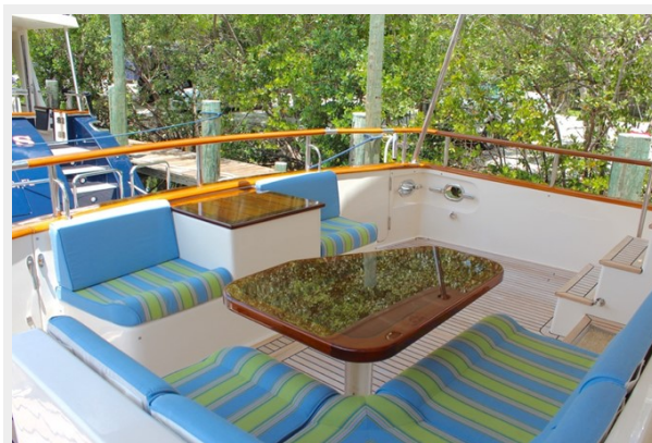
Cockpit Aft Seating