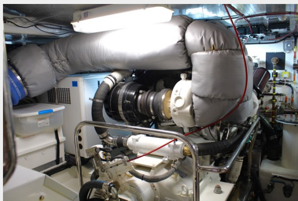
Engine Room Port