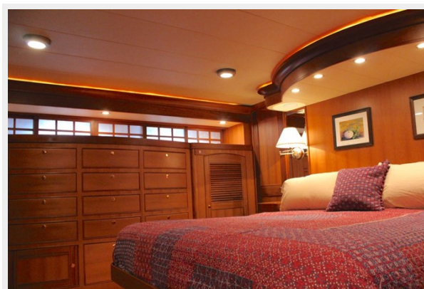
Master Stateroom Starboard