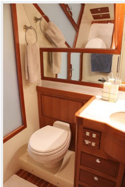
Master Stateroom Head Port