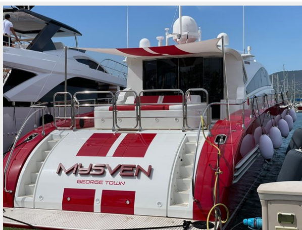
WhatsApp Image 2022-03-29 at 16.48.22