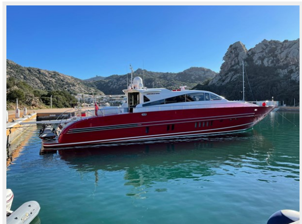
WhatsApp Image 2022-06-24 at 09.11.27 (1)