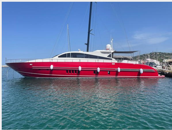
WhatsApp Image 2022-06-24 at 09.11.26 (1)