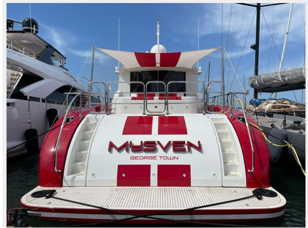
WhatsApp Image 2022-06-24 at 09.11.26