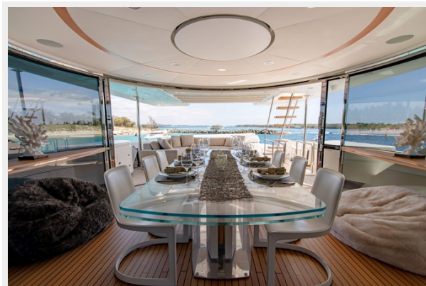
33. Customline 33m photos (3)