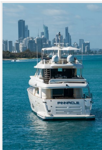
18. Customline 33m photos (19 of 75)