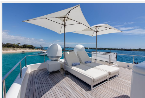
24. Customline 33m photos (60 of 75)