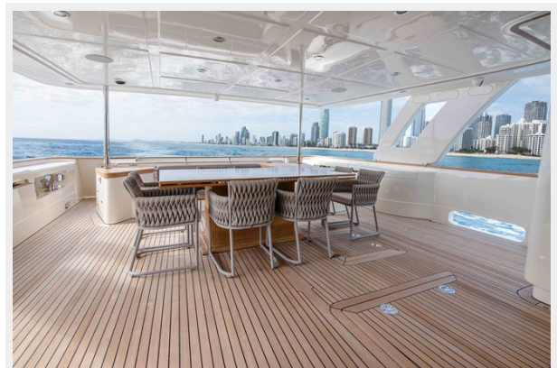
39. Customline 33m