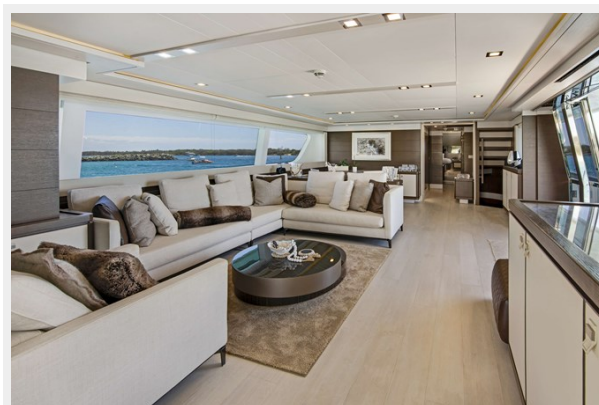
40. Customline 33m Internals (6)