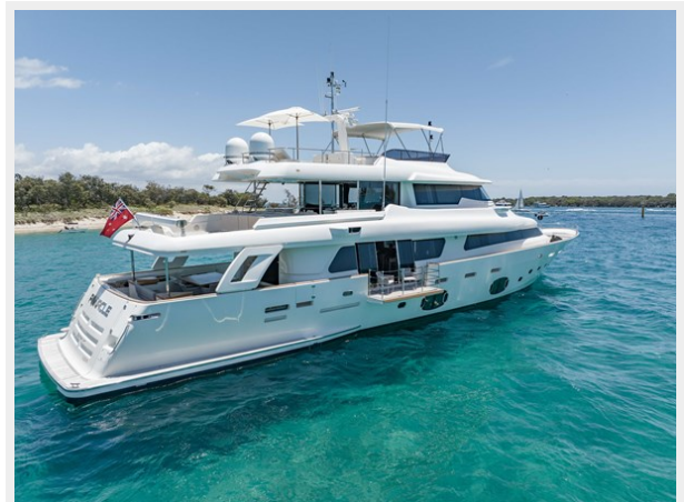
19. Customline 33m photos (66 of 75)