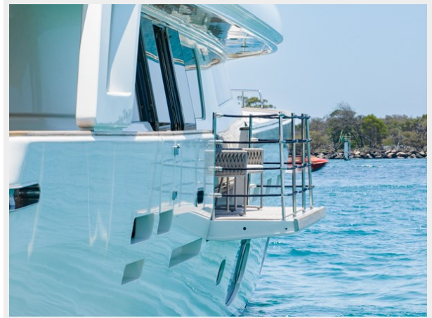
21. Customline 33m photos (68 of 75)