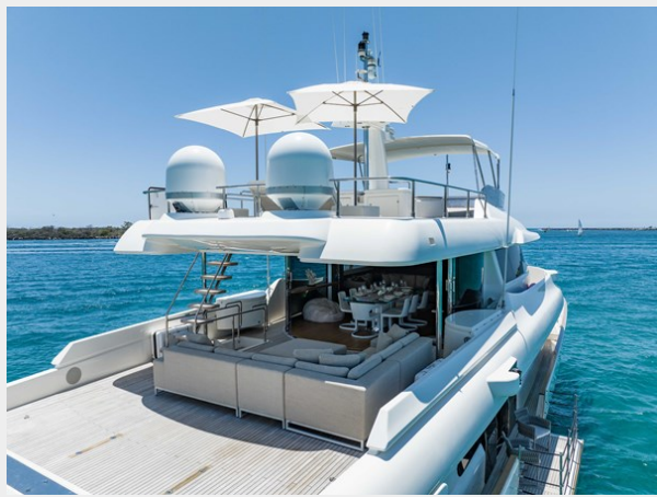
29. Customline 33m photos (62 of 75)