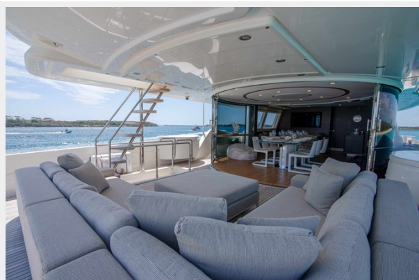
30. Customline 33m photos (2)