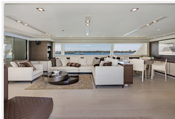
44. Customline 33m Internals (9)