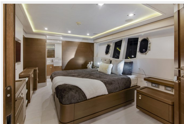
54. Guest Cabin 5 3 (12)