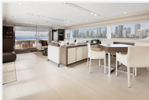
47. Customline Navetta 33 - Pinnacle (8)