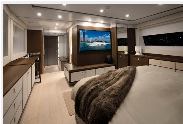
51. Accommodation Master (9)