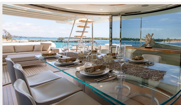
32. Customline 33m photos (4)