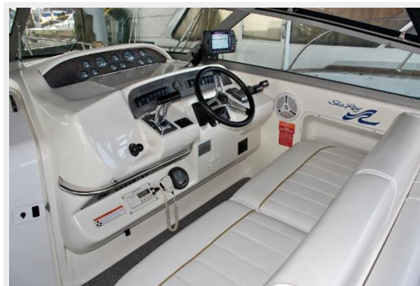
Helm Starboard View