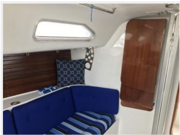
Settee Table up