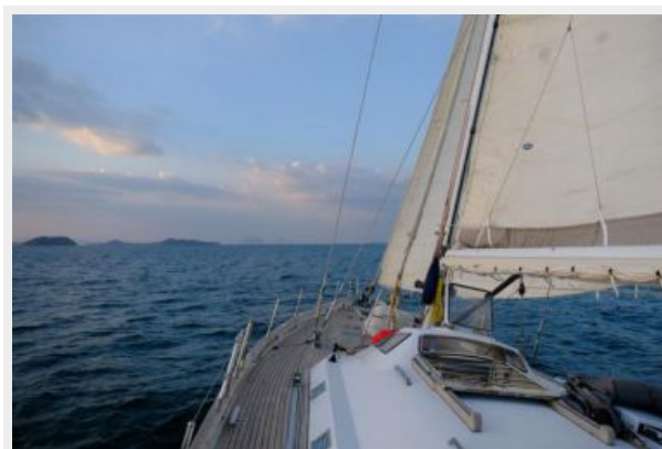
Deck and sailing