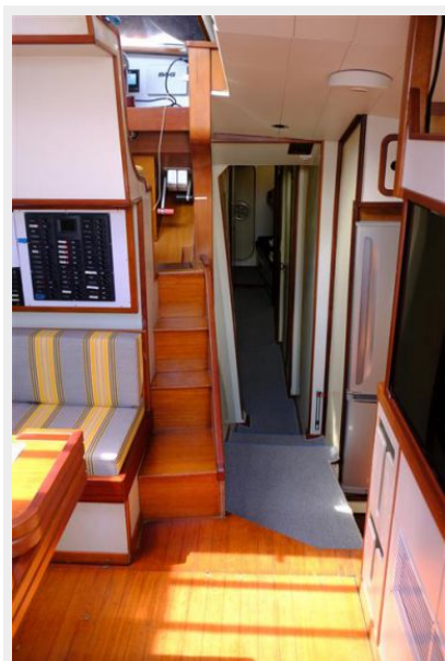
from companionway to sail locker