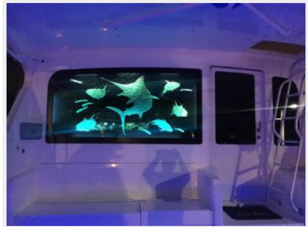
2006 Viking 61 Convertible - Cockpit