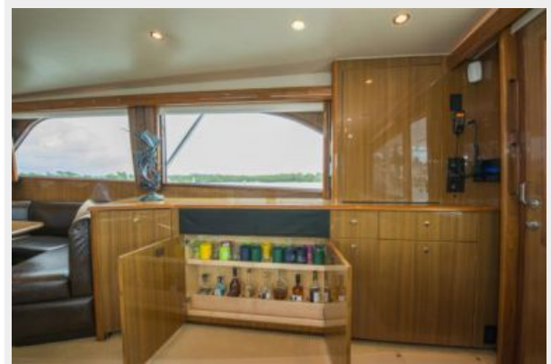
2006 Viking 61 Convertible - Salon