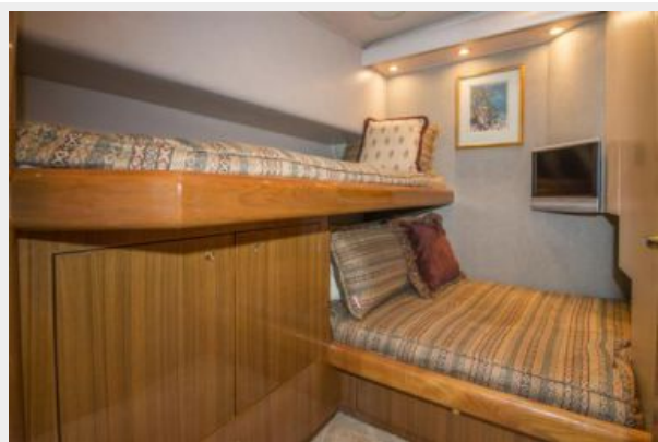
2006 Viking 61 Convertible - Guest Stateroom