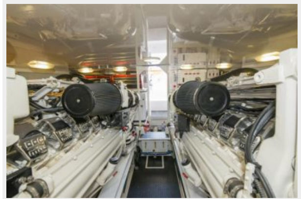
2006 Viking 61 Convertible - Engine Room