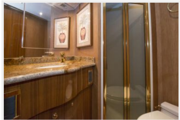
2006 Viking 61 Convertible - Guest Head