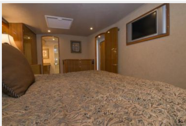
2006 Viking 61 Convertible - Master Stateroom