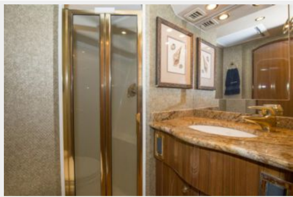
2006 Viking 61 Convertible - Guest Head