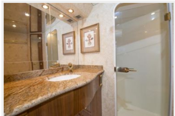
2006 Viking 61 Convertible - Master Stateroom Head