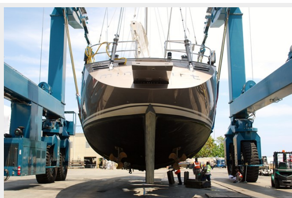
MINISKIRT - out of the water (3)