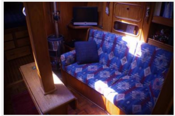
Sunken salon area to starboard