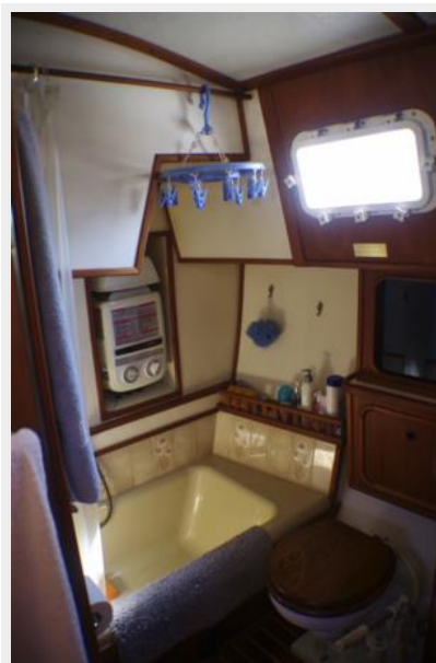
Head and Sitz bath