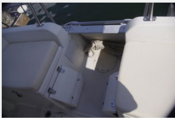
Forward cockpit access