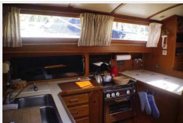
Galley area 1