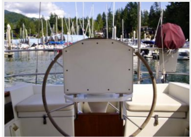
Wheel station going aft