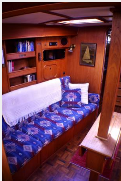
Sunken salon area to port