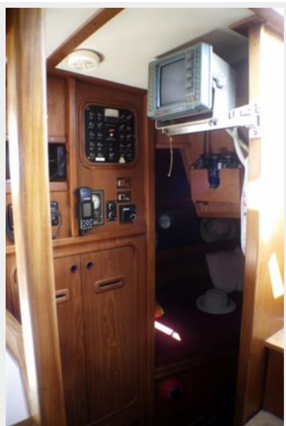
Quarter cabin access