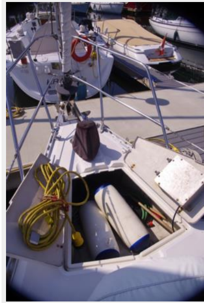
Deck anchor locker 2