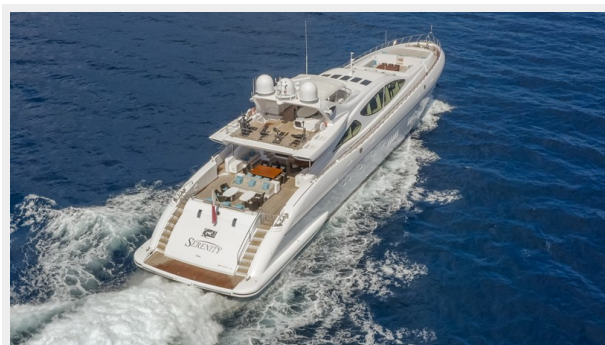
4. Running Shot 4