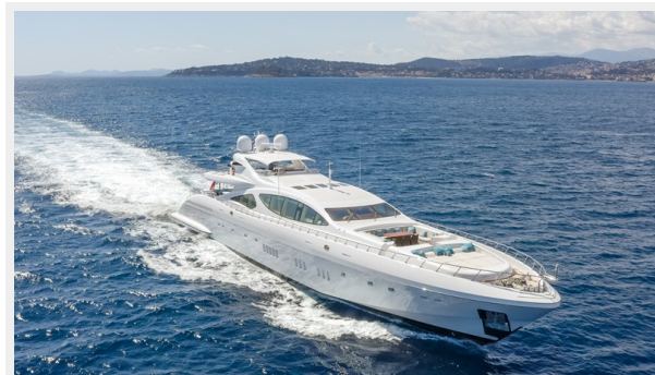
3. Running Shot 2