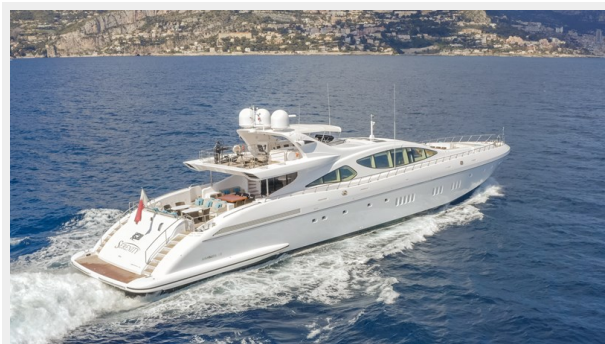
2. Running Shot 3