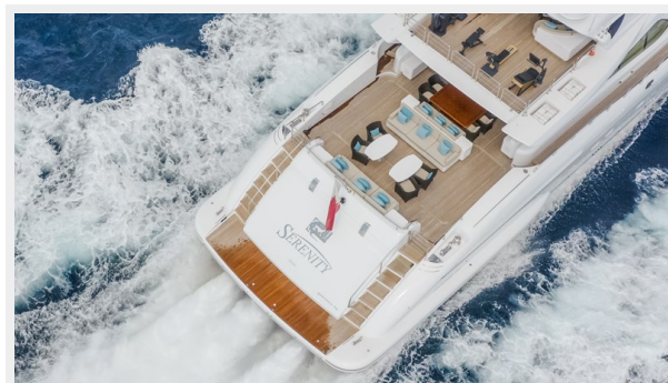
6. Aft Deck 1