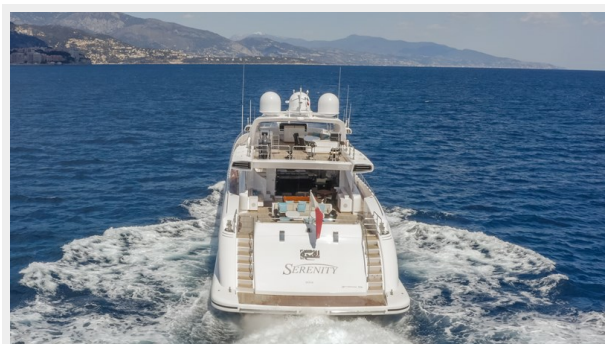
5. Aft 1