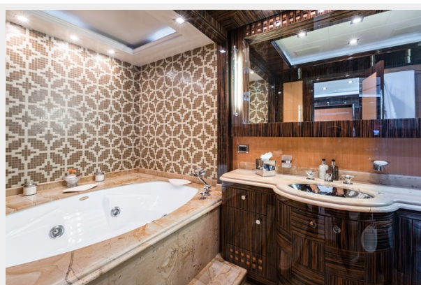
19. VIP Ensuite