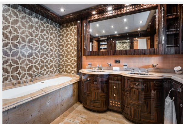
15 - Master Ensuite