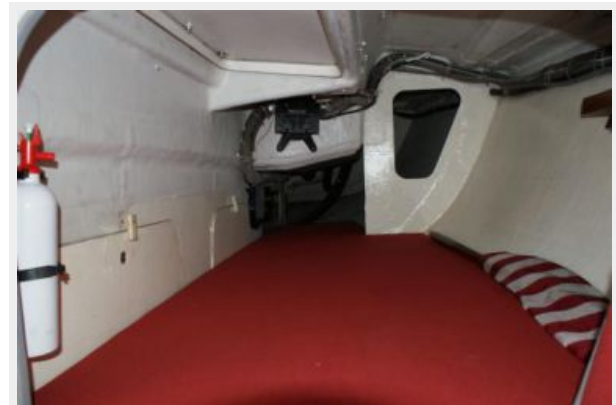
Aft Berth Close up