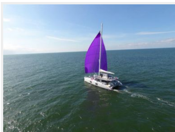
Aerial View Gennaker 1