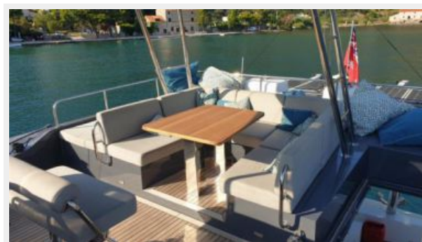
Flybridge Looking Aft