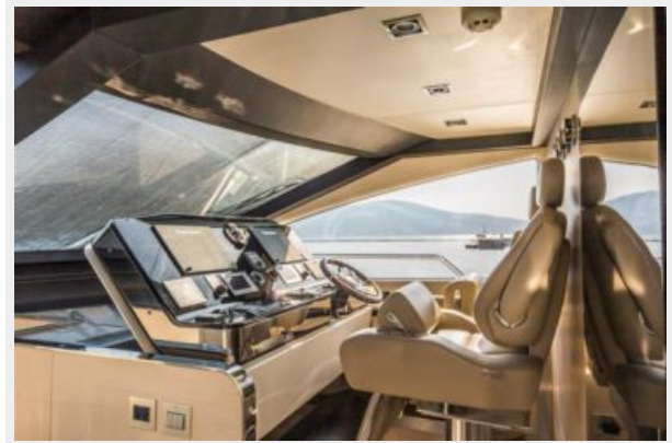
Main helm station