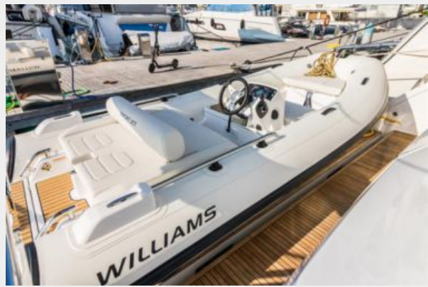
Tender on swimming platform