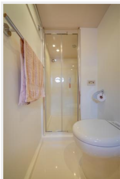
Master Head 1