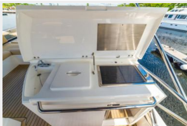
Flybridge 9 - Copy