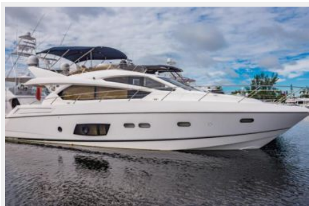
Exterior 2 - Copy