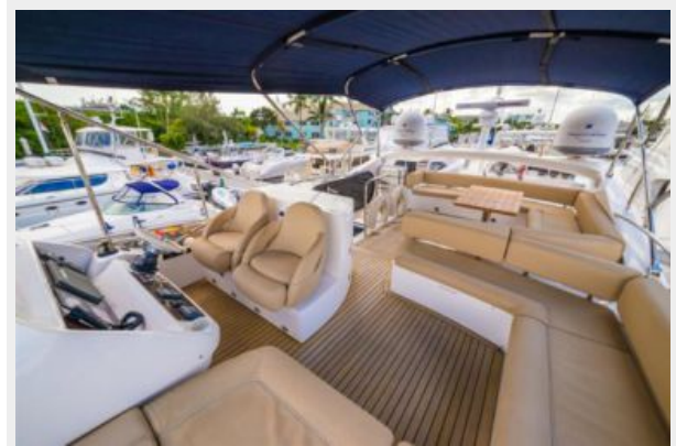
Liquid Fusion- Flybridge 4