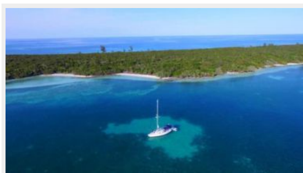
7234817_20191001102716282_1_XLARGE - Copy