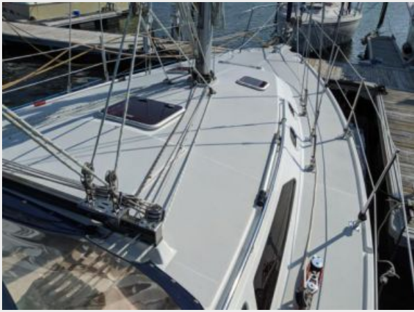
7234817_20191001103528394_1_XLARGE - 7234817_20191001103503537_1_XLARGE - Сору Сору