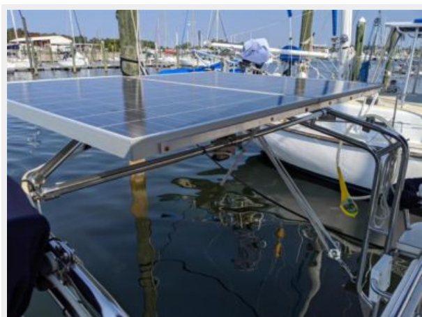
7234817_20191001104037655_1_XLARGE - Copy