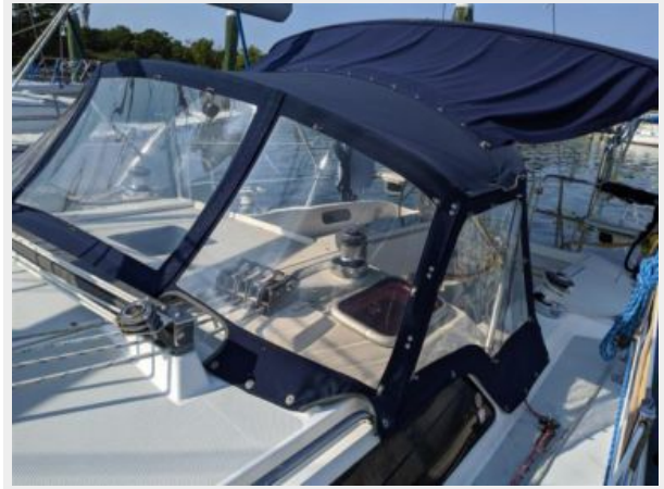
7234817_20191001103455052_1_XLARGE - 7234817_20191001103412682_1_XLARGE Сору