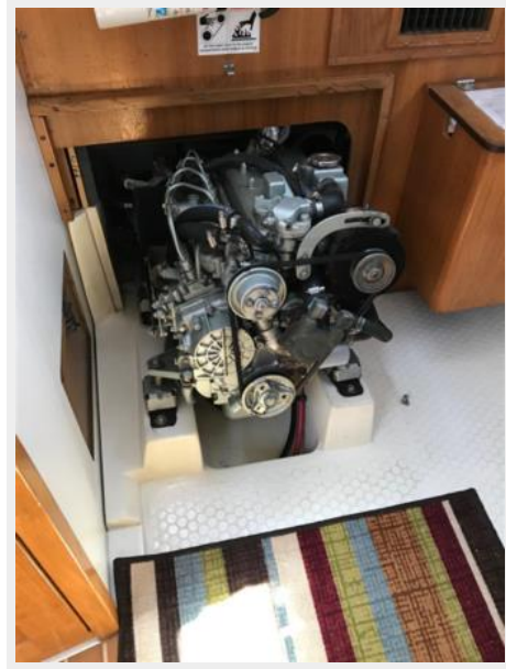
7234817_20191001103422172_1_XLARGE - Copy