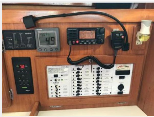
7234817_20191001184706496_1_XLARGE - Copy