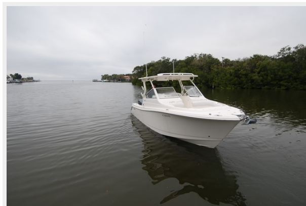
Strb Bow On