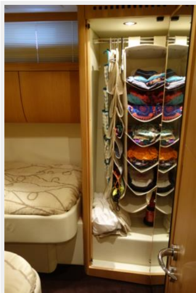
Twin guest closet