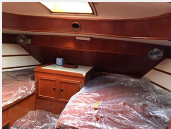
Aft cabin with a double and a single berth