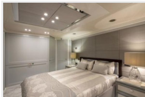
Guest Double Cabin 1