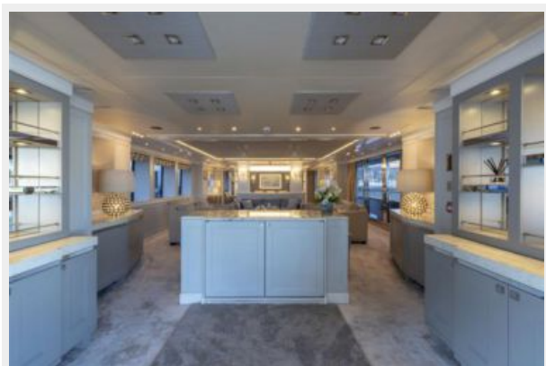
Main Salon Entry