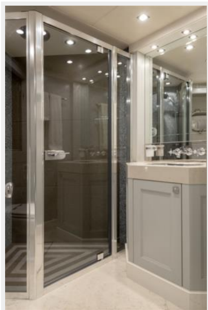
Guest Cabin Ensuite