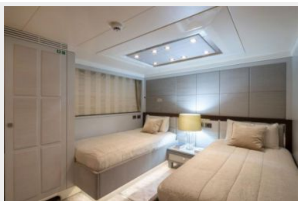
Twin Guest Cabin Port