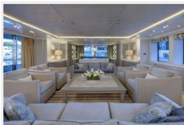
Main Salon Seating