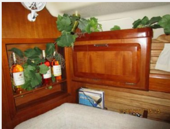
13-Pearl Salon Cabinry 2