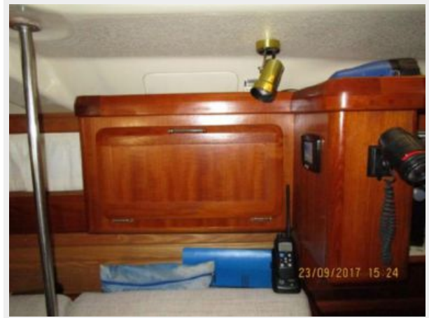
12-Pearl Salon Cabinetry