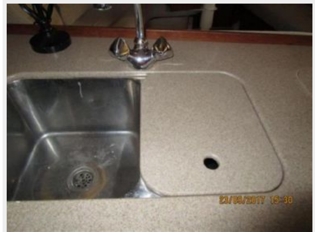
20-Pearl Galley Sink