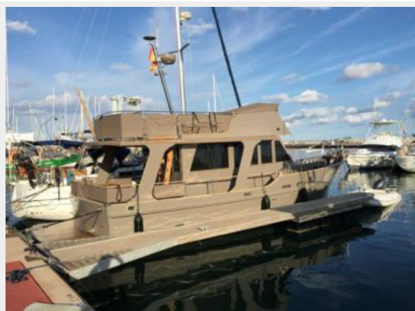
Island Gypsy Profile