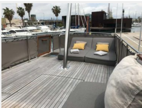
Island Gypsy 36 Exterior