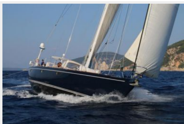
Fifty Fifty sailing