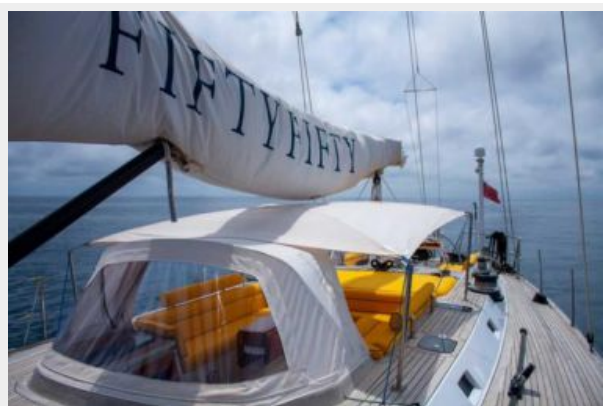
Fifty Fifty yacht boom