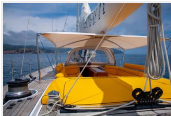
Fifty Fifty yacht deck