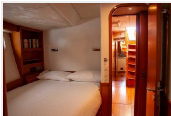
Fifty Fifty stateroom