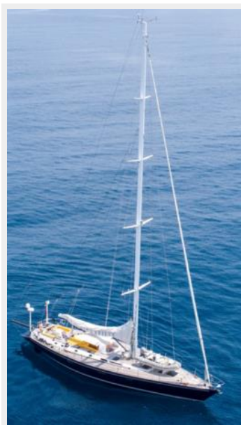
Fifty Fifty Construction Navale Bordeaux