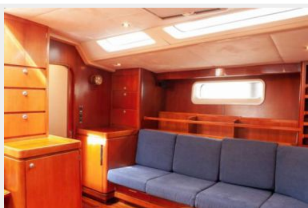
Fifty Fifty saloon