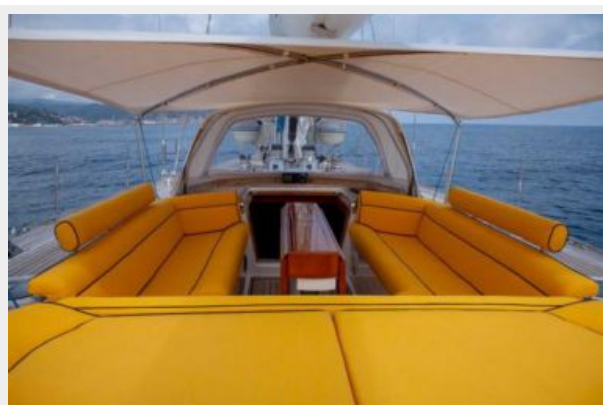
Fifty Fifty settee