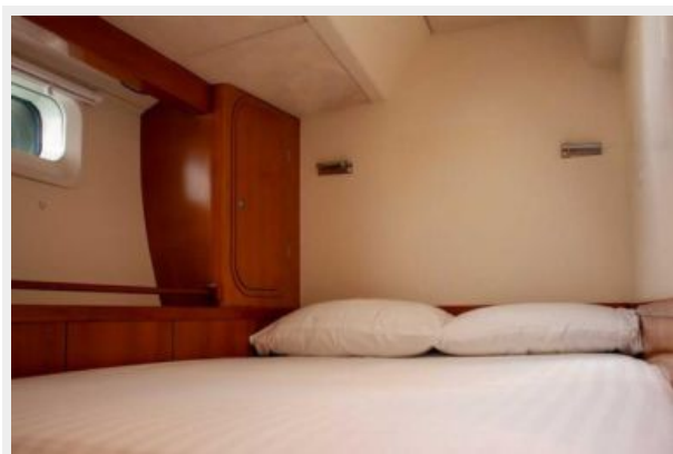
Fifty Fifty bed