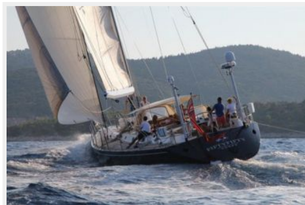
Fifty Fifty yacht at sea