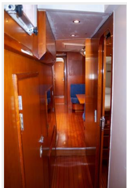
Fifty Fifty corridor