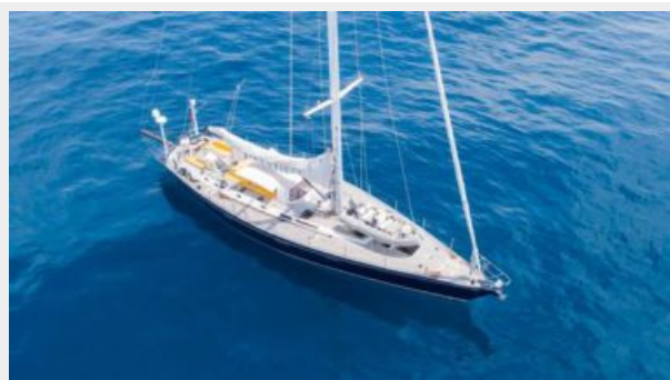
Fifty Fifty CNB yacht