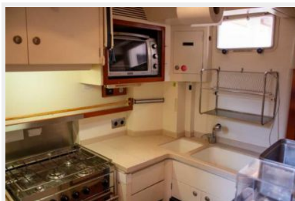
Fifty Fifty galley