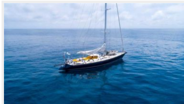
Fifty Fifty yacht sailing