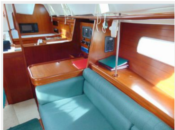
Galley and Navigation Station