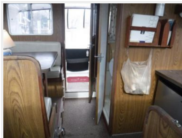
8 Salon Aft View