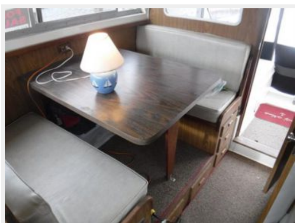
11 Salon Table