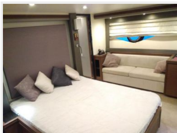
12 Double cabin-Marquis 630