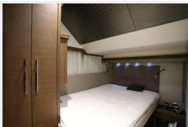
08 Double-Marquis 630