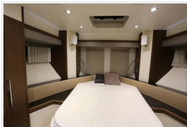
09 Double cabin-Marquis 630