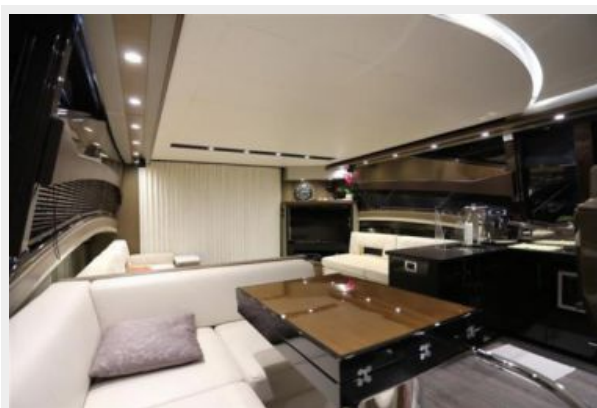
15 Main salon galley-Marquis 630