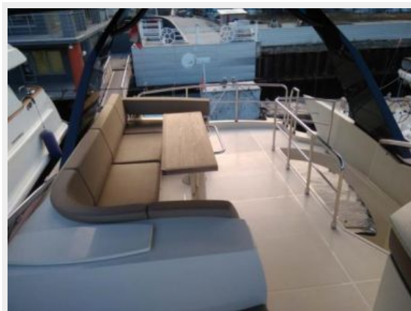
11 Exterior-Marquis 630