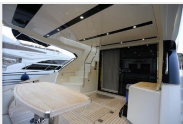
12 Aft Deck-Marquis 630