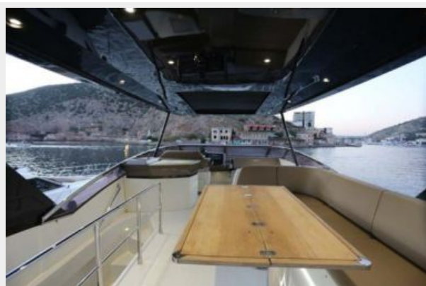
10 Exterior Marquis 630