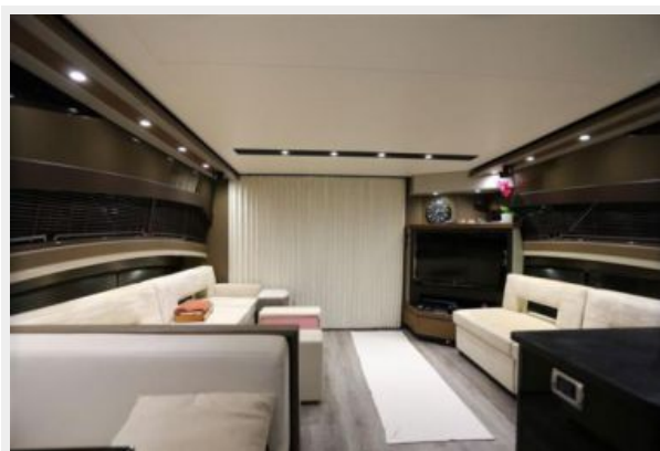
14 Main salon-Marquis 630