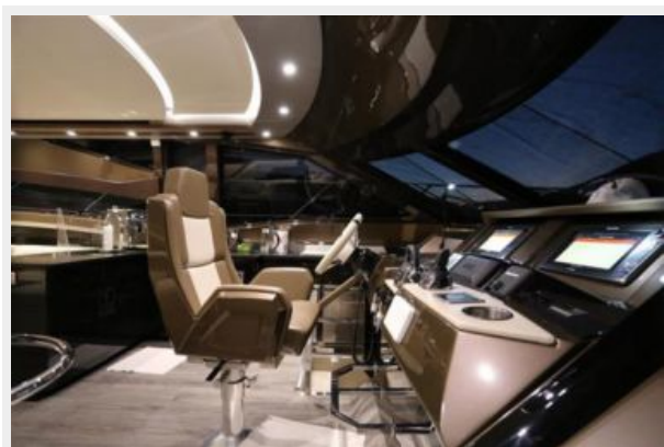
05 Bridge-Marquis 630