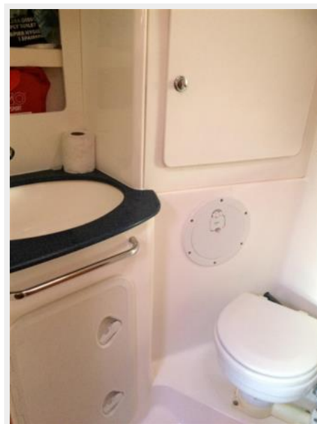
Head and shower compartment