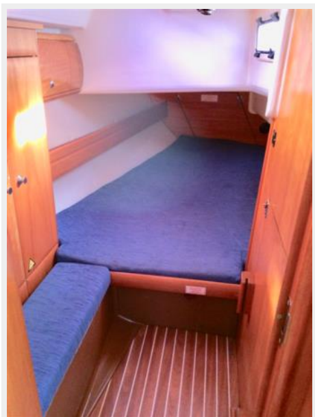
Starboard aft stateroom