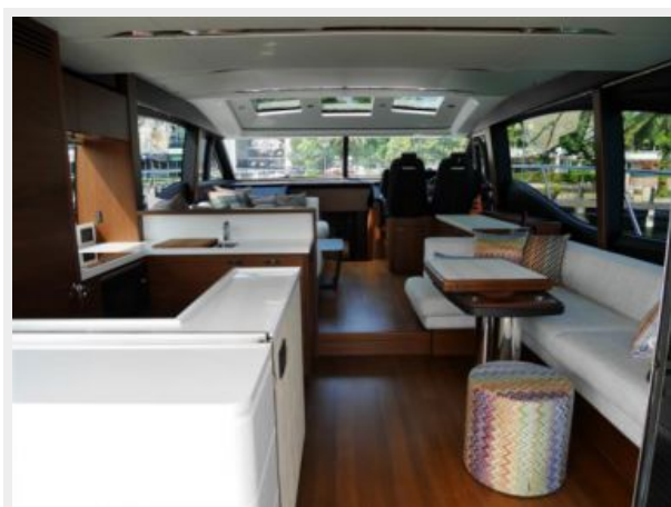
Main Deck 1