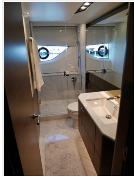
Master Stateroom En Suite