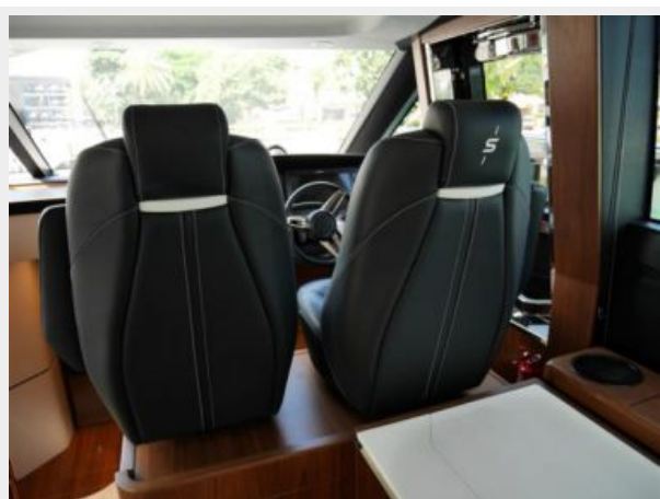
Lower Helm Seats