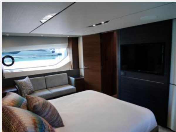
Master Stateroom 4