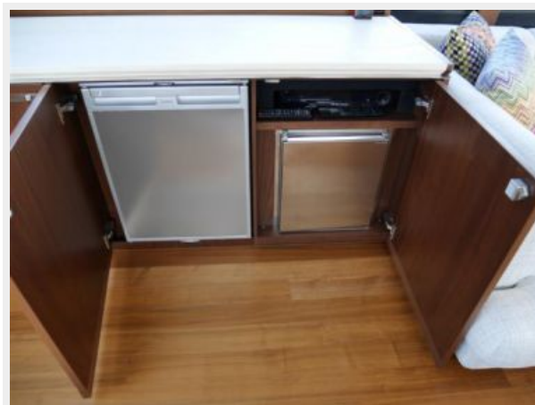
Fridge & Ice Maker