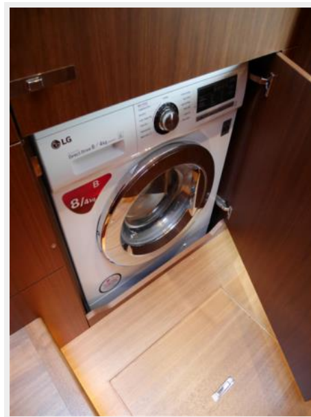
Combi Washer Dryer