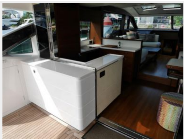
Galley Area 1