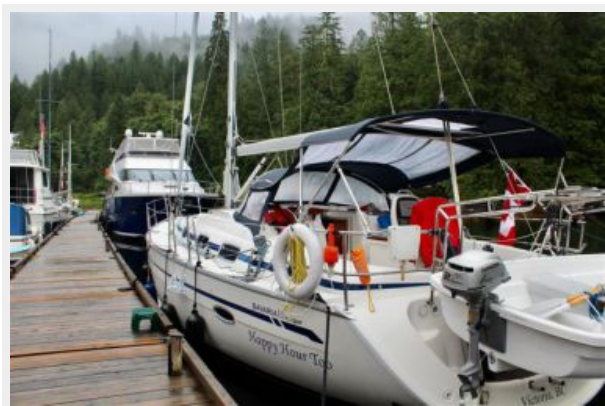
Happy Hour Too