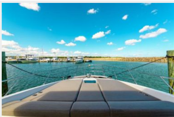
Azimut 66 Flybridge - Alisius 2019 (24)