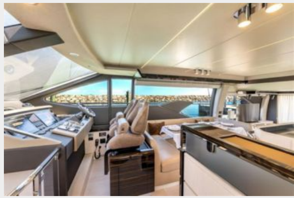
Azimut 66 Flybridge - Alisius 2019 (18)