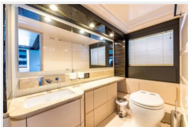
Azimut 66 Flybridge - Alisius 2019 (8)