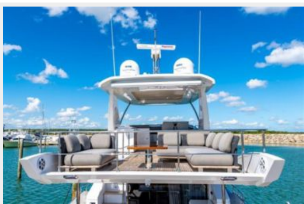
Azimut 66 Flybridge - Alisius 2019 (3)