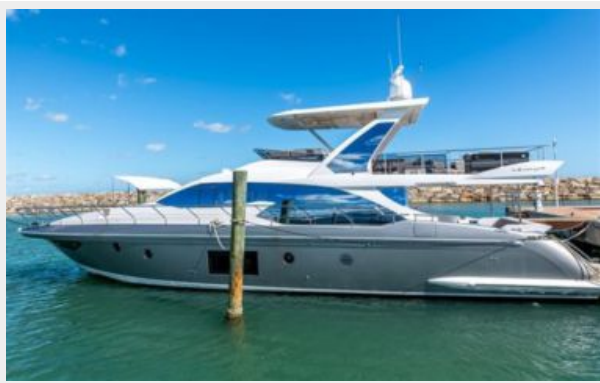
Azimut 66 Flybridge - Alisius 2019 (1)