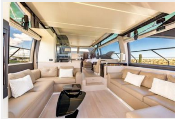
Azimut 66 Flybridge - Alisius 2019 (4)