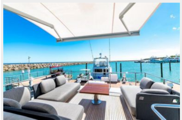
Azimut 66 Flybridge - Alisius 2019 (20)