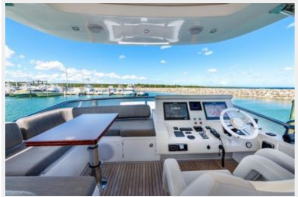
Azimut 66 Flybridge - Alisius 2019 (22)