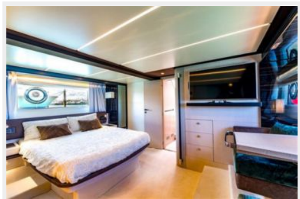
Azimut 66 Flybridge - Alisius 2019 (7)