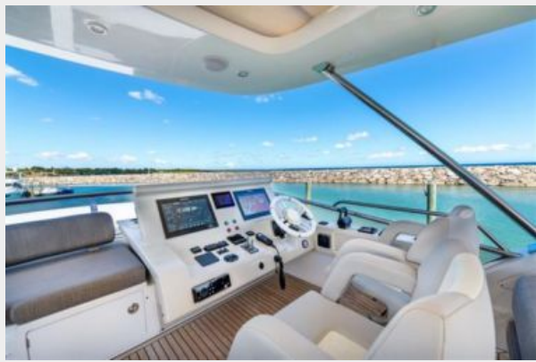
Azimut 66 Flybridge - Alisius 2019 (26)