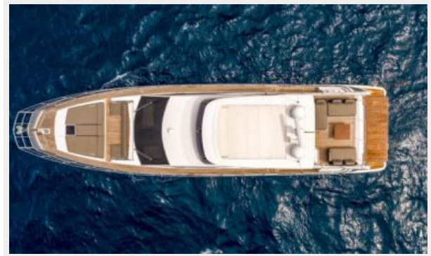
Azimut 66 Flybridge - Alisius 2019 (2)