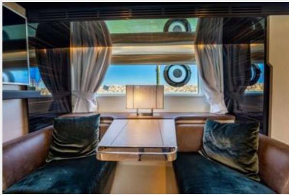
Azimut 66 Flybridge - Alisius 2019 (10)