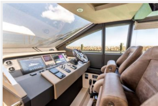
Azimut 66 Flybridge - Alisius 2019 (6)