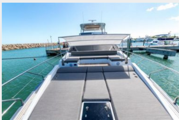
Azimut 66 Flybridge - Alisius 2019 (23)