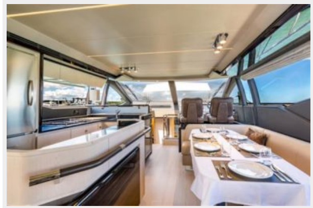
Azimut 66 Flybridge - Alisius 2019 (5)