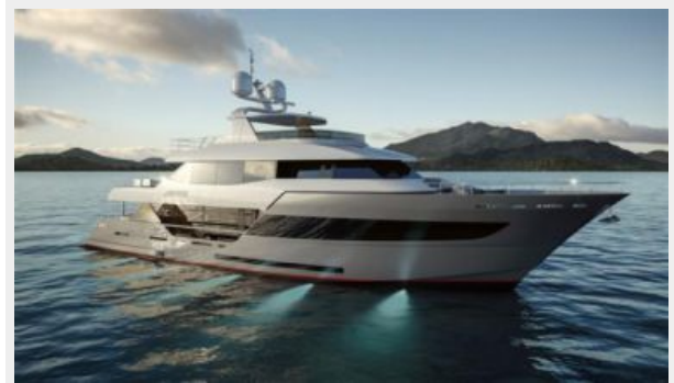
A 100 -Image 02-HR