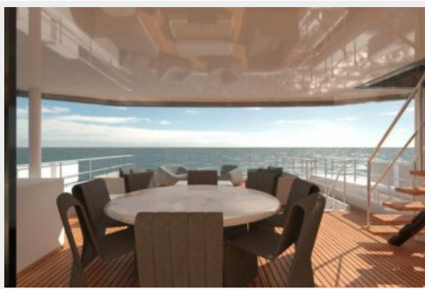
A 100 -Image 07-HR