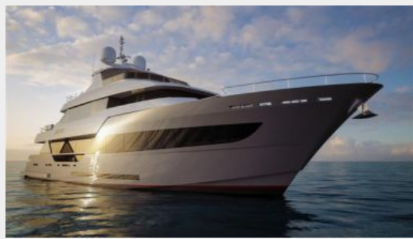
A 100 -Image 05-HR