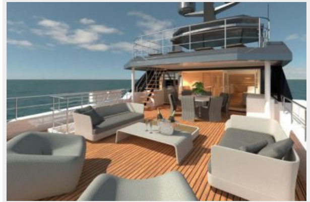
A 100 -Image 06-HR