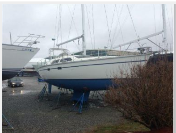
ASHORE STB SIDE VIEW