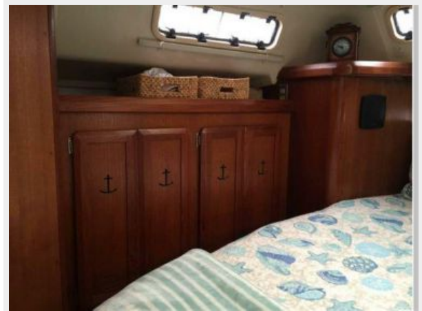
LOCKERS AND STORAGE ON STB SIDE IN MASTER CABIN