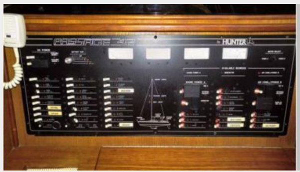
ELECTRIC PANEL AT NAV STATION