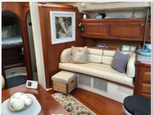
MAIN SALON STARBOARD SETTEE