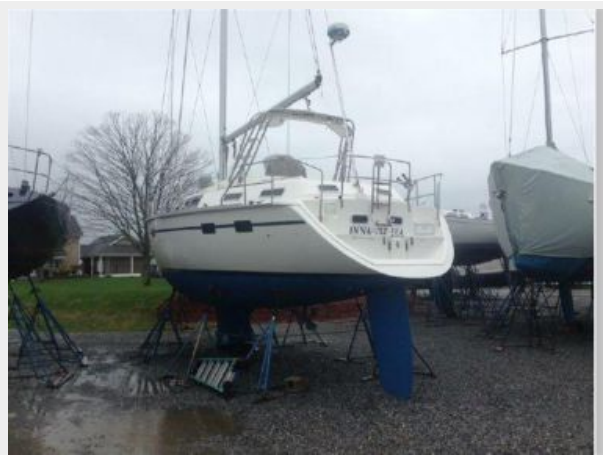
ASHORE PORT STERN QUARTER