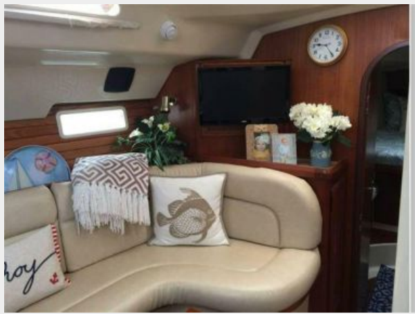
FORWARD END OF MAIN SALON SETTEE