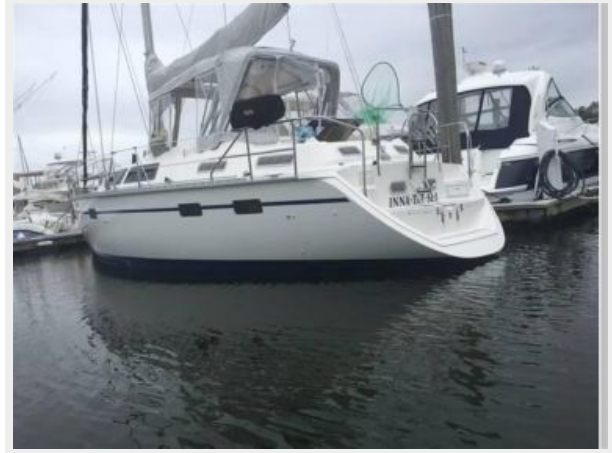
STERN QUARTER VIEW RAIL GRILL WITH COVER