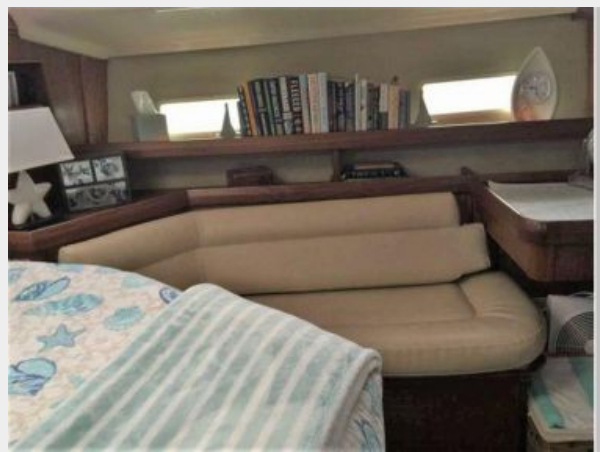
SETTEE ON PORT SIDE IN MASTER STATEROOM