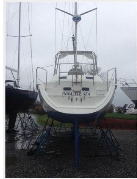
ASHORE STERN VIEW