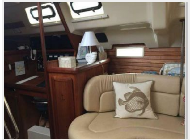
AFT END OF MAIN SALON SETTEE