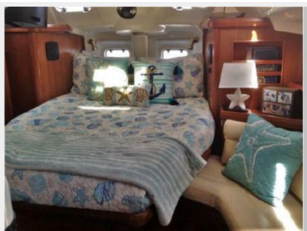
VIEW ENTERING MASTER CABIN