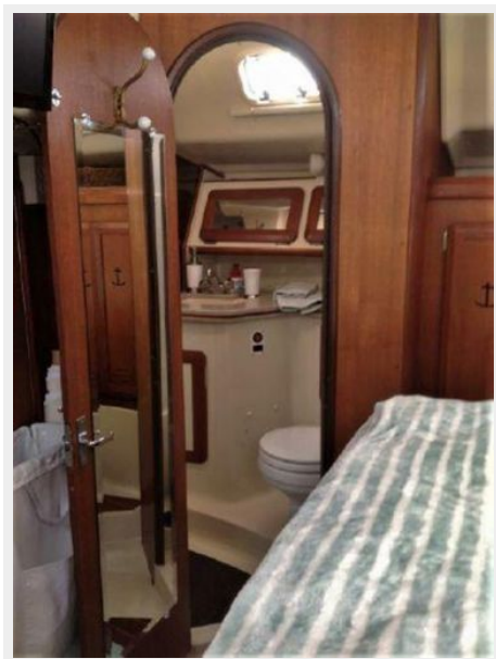
LOOKING INTO MASTER BATH FROM MASTER STATE ROOM