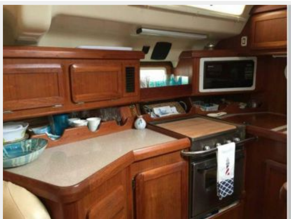
GALLEY LOOKING AFT