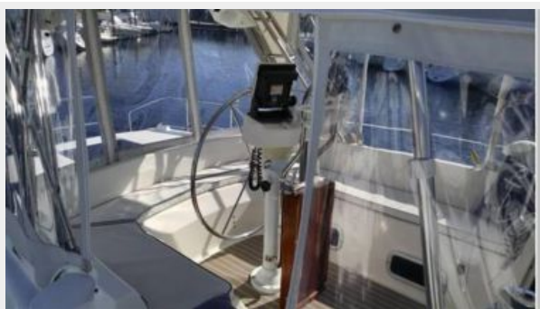
FULLY ENCLOSED COCKPIT PRIVACY PANELS INCLUDED