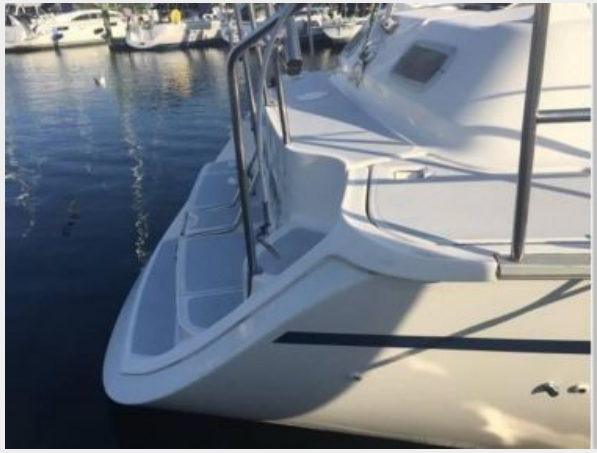
LARGE SWIM PLATFORM RETRACTED LADDER SAFE BOARDING