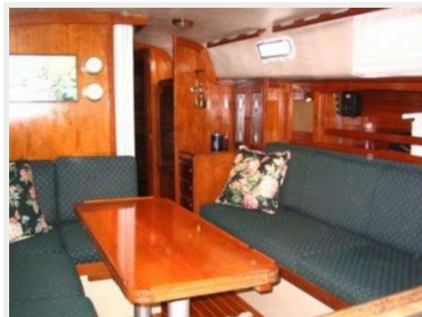
MAIN CABIN TABLE AT HALF