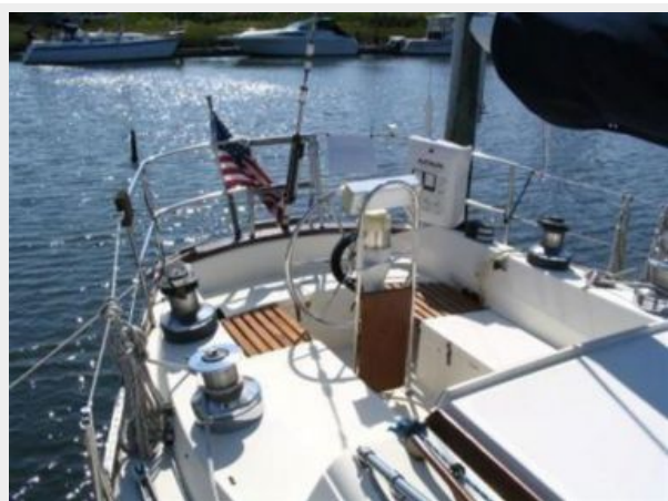
COCKPIT LOOKING AFT