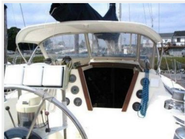
COCKPIT LOOKING FORWARD