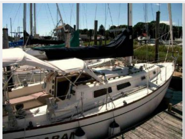
DODGER,BIMINI AND CONNECTOR