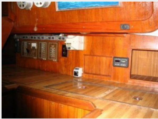
GALLEY CLOSE UP