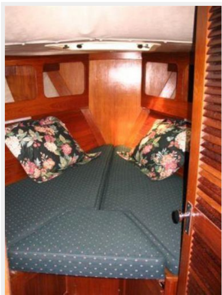
FWD STATEROOM LARGE V BERTH