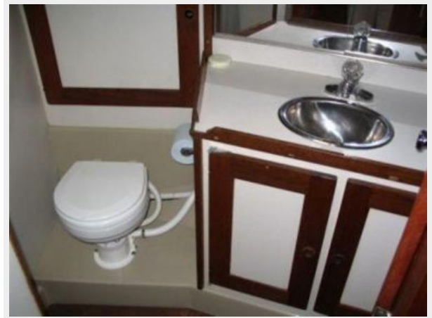
HEAD WITH VANITY AND SHOWER