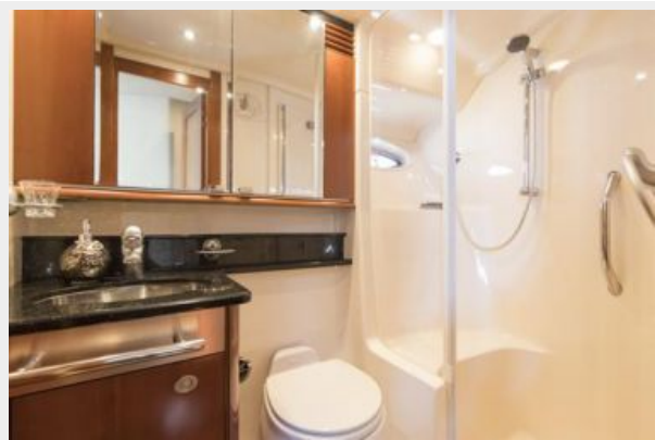
Master head with shower