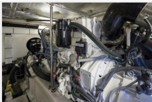
Engine room 3