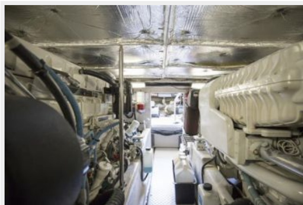
Engine room 2