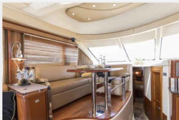
Dinette view 2