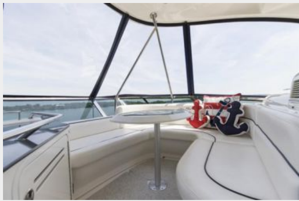
Flybridge view 2