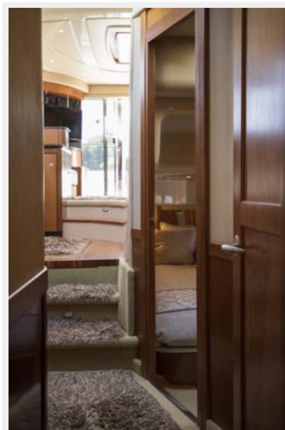
Steps to the staterooms