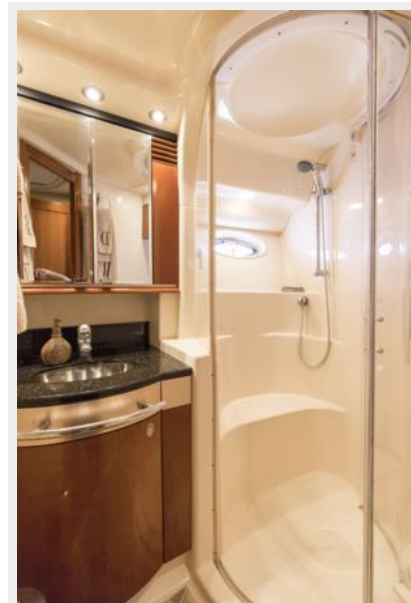
Guest vanity and shower