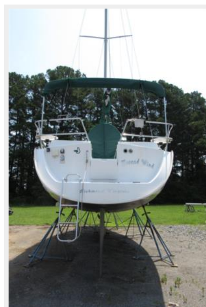
Transom with ladder down