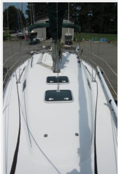
Deck from bow