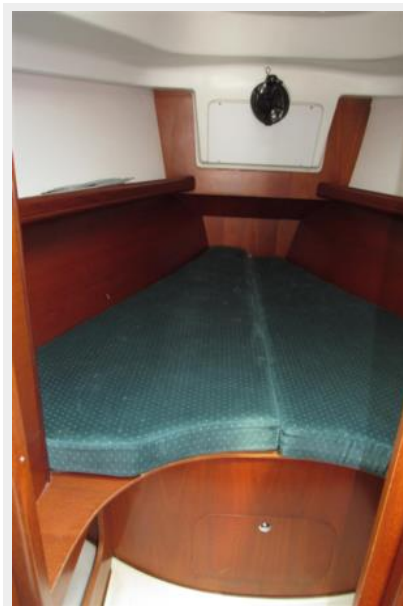
V-berth without filler cushion