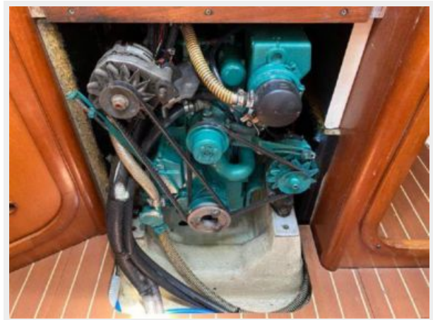
Vovlo Penta MD 2040