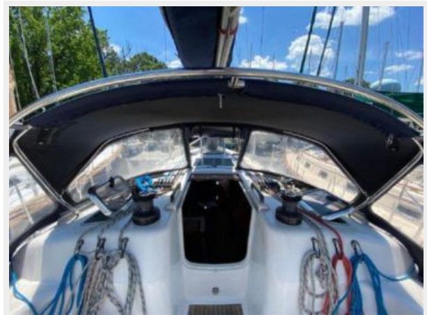
Running Rigging to Cockpit