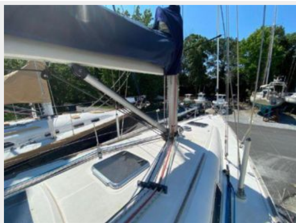
Topsides/New Vang 2020