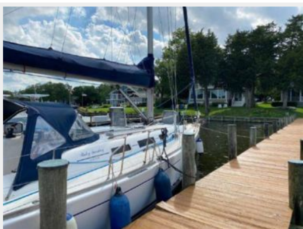
In the water - June 2020