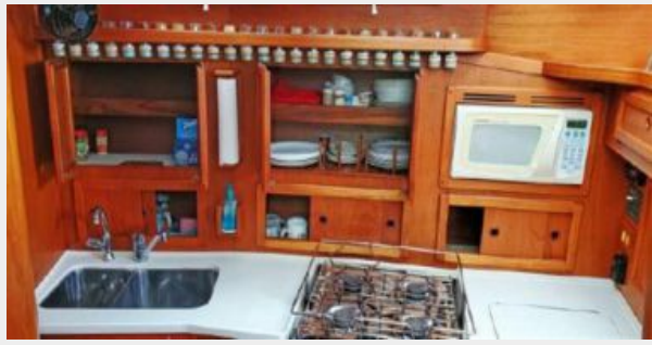
Galley Cabinets Stbd Open