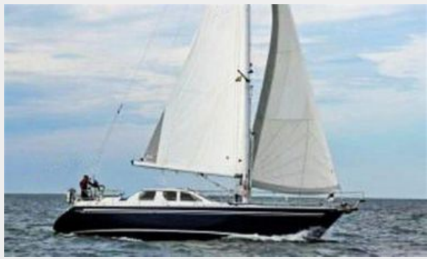
Nauticat Under Sail