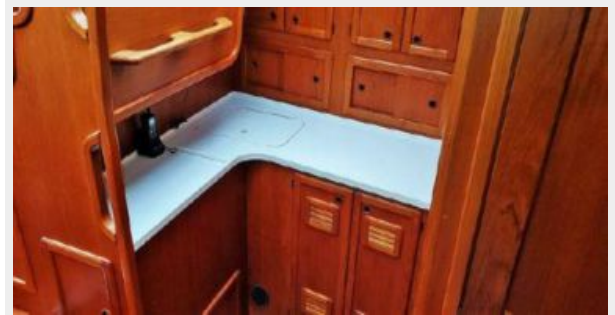
Galley Port Side Storage and Freezer