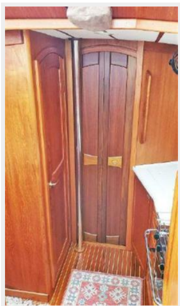
Fwd Head and Fwd Cabin Doors