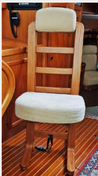
Adjustable Teak Helm Seat