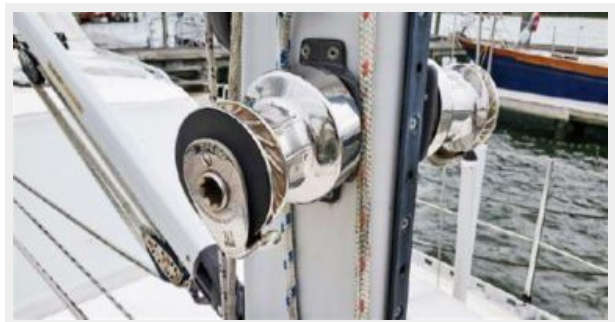
Anderson Mast Winches