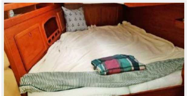
Aft Cabin Storage and Book Shelf