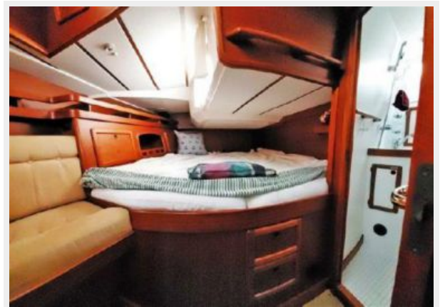
Aft Cabin Wide