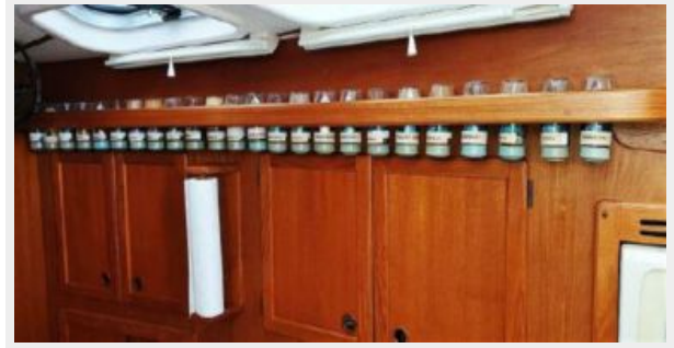
Custom Spice Rack