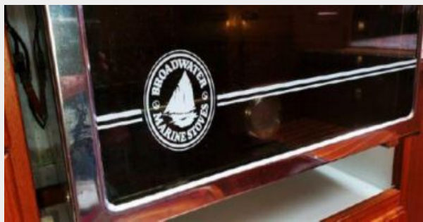
4 Burner Broadwater Stove/ Oven