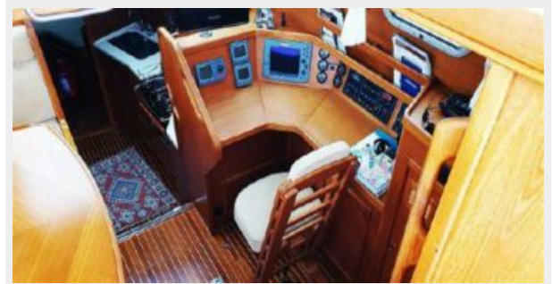
Pilothouse Helm Station