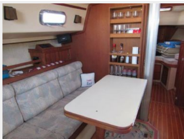
Dining Table Partially Deployed