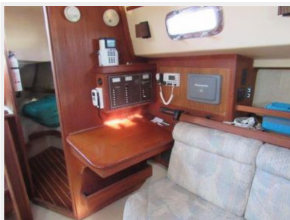
Chart Desk Looking Aft