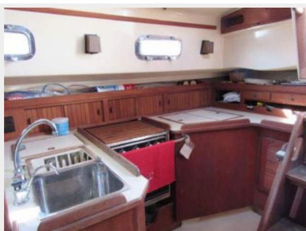
Galley With Good Ventilation