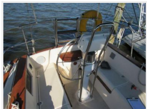
Pedestal Mounted Steering