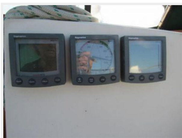
Knot, Depth, WD/WS on Bulkhead