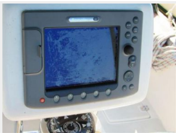
Radar/Chartplotter At Helm