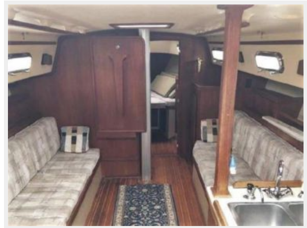
Main Saloon looking Forward